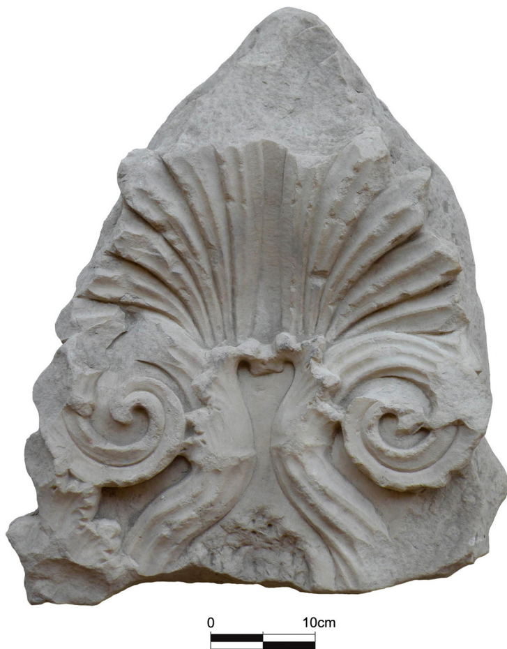
Figure 4. Stèle fragmentaire à anthémion en marbre, découverte à Kition (Musée de Larnaca, MLA 947).