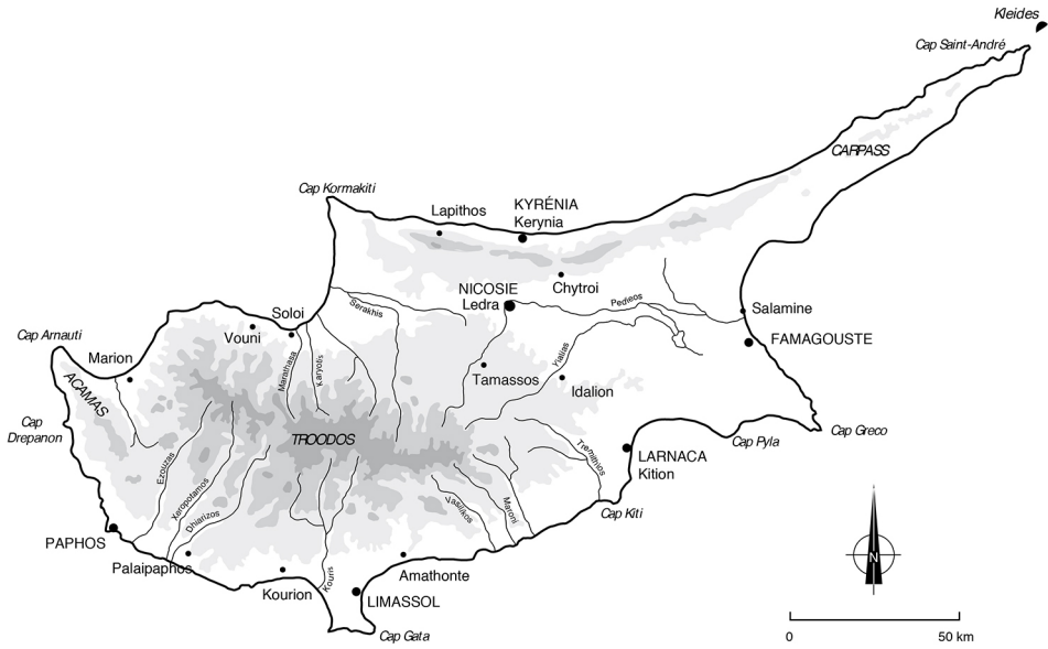
Figure 1. Carte de Chypre. HiSoMA-UMR 5189, MOM (Maison de l'Orient et de la Méditerranée).