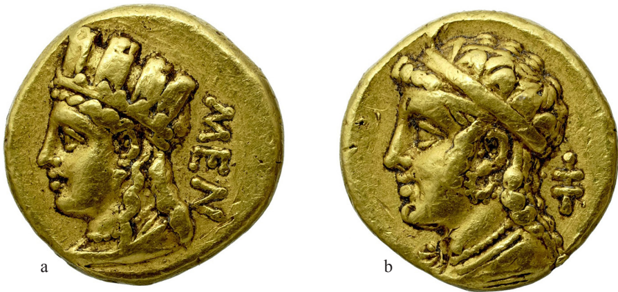
Figure 2a-b. 1/3 de statère en or de Salamine, roi Ménélas (vers 310). Bnf, département des Monnaies, médailles et antiques. ark:/12148/btv1b8535020f