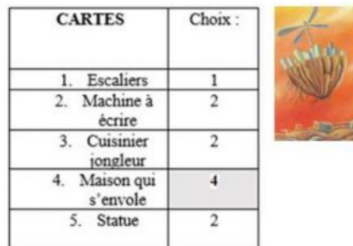
Figure 4 : Cartes choisies quant à la représentation de la mise en place de l'entreprise libérée