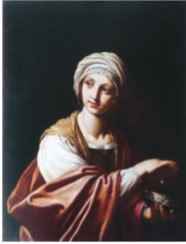
1. Elisabetta Sirani, Cléopâtre , Huile sur toile (95 x 75 cm), v. 1663 Flint Institute of Art, Michigan.