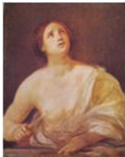
5. Guido Reni, La Mort de Lucrèce , Huile sur toile (91 x 73 cm), v. 1640-1642, Pinacothèque Capitoine, Rome.