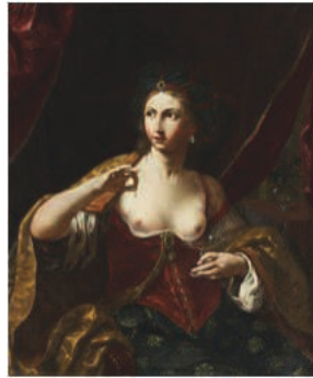
2. Elisabetta Sirani, Cléopâtre , Huile sur toile, 1664, Collection privée L. Zanasi, Modène.