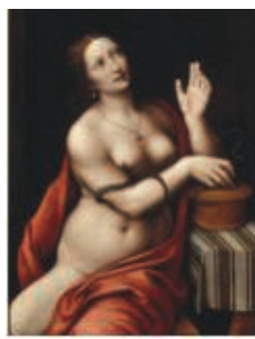
10. Giampietrino, Le Suicide de Cléopâtre , Huile sur panneau (94 x 70 cm), v. 1524-1526, Samek Art Gallery, Bucknell University, Lewisburg, Pennsylvania.