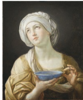
4. Guido Reni, Artémise , Huile sur toile (73,5 x 61 cm), 1638, Birmingham Museums and Art Gallery.