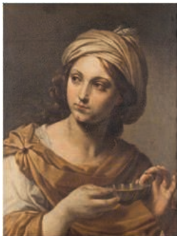
3. Simone Cantarini, Sophonisbe , Huile sur toile (64 x 49 cm), v. 1637-1639, Fondazione Sorgente Group, Rome.