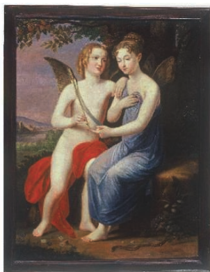
Cupidon et Psyché, par Marie-Christine, Museo de Historia de Madrid, 64 x 51 cm.

La publicité faite à certains ouvrages fut parfois l'occasion de souligner en outre l'étendue des centres d'intérêt de la reine. Ce fut le cas au mois de février avec un traité technique sur le cheminement et la gestion des eaux ( Tratado sobre el movimiento y aplicaciones de las aguas ) auquel, souligna-t-on, la reine avait souscrit 65 . Les félicitations de l'Académie Royale des Sciences naturelles et des Arts de Barcelone, publiées également en février 66 , furent l'occasion de mettre en avant la modernité d'une reine à qui l'on devait la création du Ministère du développement 67 . Enthousiasme partagé, dans un tout autre domaine, par les membres cette fois de l'Académie Royale des Beaux-Arts de San Fernando à qui la reine avait offert le 7 avril une huile sur toile signée par elle.