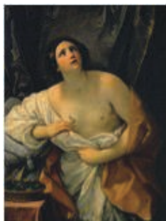
6. Guido Reni, La Mort de Cléopâtre , Huile sur toile (125,5 x 97 cm), 1638-1639, Galerie Palatine, Palais Pitti, Florence.