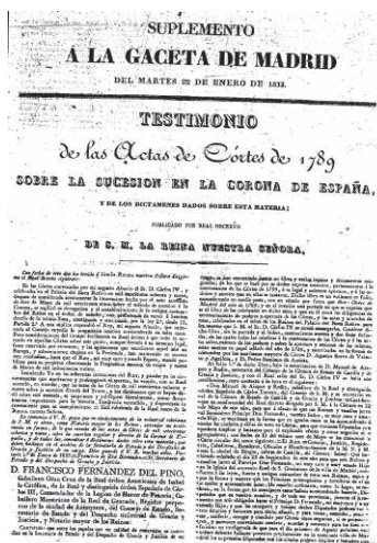
Colección du B.O.E.

Bien qu'elle eût recouvré son « simple » statut de reine consort, sa présence dans le périodique officiel ne pâlit guère. Le titre du Testimonio de las Actas de las Cortes de 1789 sobre la sucesión a la Corona de España... , objet d'un supplément de la Gaceta du 22 janvier, précisait que c'est à un décret de la reine que l'on devait cette publication, dont l'importance fut en outre soulignée par une présentation graphique aussi inhabituelle que soignée.