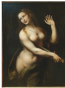
8. Giampietrino, Le Suicide de Lucrèce , Huile sur panneau (95,8 x 72,3 cm), v. 1525, Chazen Museum of Art University of Wisconsin, Madison.