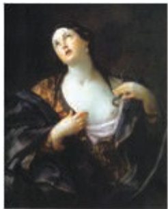
7. Guido Reni, La Mort de Cléopâtre , Huile sur toile (124 x 94 cm), 1625-1626, Bildergalerie, Sanssouci, Potsdam.