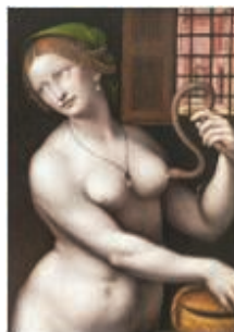
9. Giampietrino, Le Suicide de Cléopâtre , Huile sur panneau (73 x 57 cm), 1538, Musée du Louvre, Paris.