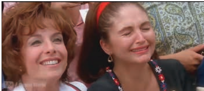
Apollo 13 , de haut en bas : l'astronaute Ken Mattingly (Gary Sinise) ; Marilyn Lowell (Kathleen Quinlan) et Mary Haise (Tracy Reiner)