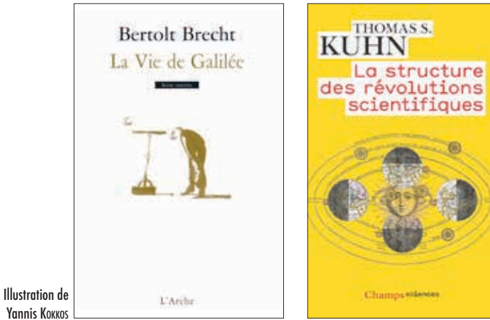
Illustration de Yannis Kokkos

L'archétype même de l'étrangement cognitif est donc lié à un événement extrêmement fort, de ceux qui, de loin en loin, sont susceptibles de provoquer une authentique révolution scientifique ; c'est-à-dire, dans le lexique de Thomas Kuhn, à un changement de paradigme . 20