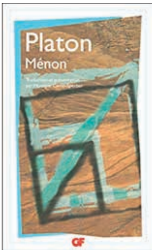
Illustration de Caroline CHAMBEAU

Le paradoxe de l'apprentissage est au moins aussi ancien que la philosophie : comment saurais-je que chercher, et comment le chercher, puisque je ne le connais pas encore, s'angoisse déjà Ménon dans son dialogue avec Socrate 1 . La plupart des théories modernes de l'apprentissage, dites socio-constructivistes, y apportent la même réponse évidente que le philosophe : tu n'es pas seul et, si tu ne disposes pas encore, a priori , des compétences nécessaires pour accéder aux connaissances désirables, celles-ci peuvent être progressivement construites par la confrontation d'idées lors d'interactions sociales, avec tes pairs comme avec d'autres personnes