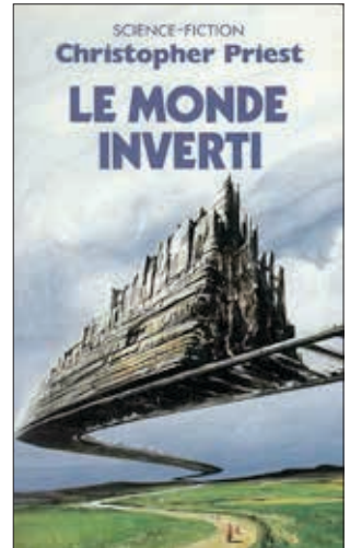
Illustration de Wojtek SIUDMAK

Ce type d'émerveillement (l'anglais dit joliment « sense of wonder » 4 ) peut intervenir dès la première phrase d'un texte – on pense par exemple à l'entame du Monde inversé , de Christopher Priest : « J'avais atteint l'âge de mille kilomètres » 16,17 – comme se construire