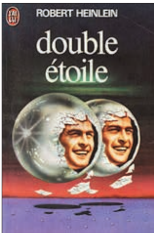
Illustration de Wojtek SIUDMAK

Il y a cette main du policier sur votre épaule, le vertige dans le noir de cette dernière marche d'escalier qui n'est pas là, il y a ce moment où vous tombez du lit, et il y a le retour imprévu du mari... 26