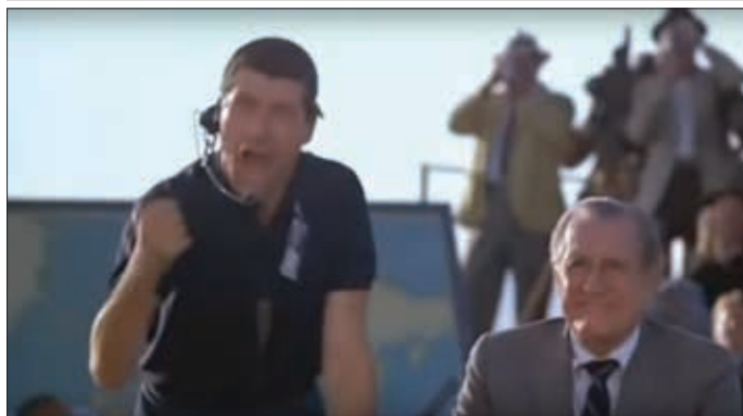
L'Étoffe des Héros , de haut en bas : un texan anonyme ; l'astronaute Gus Grissom (Fred Ward) ; page précédente : l'astronaute Gordon Cooper (Dennis Quaid)