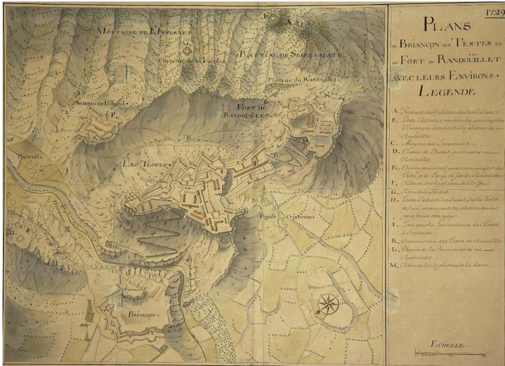
Fig. 4. - Plan des forts de Briançon au milieu du XVIII e siècle.