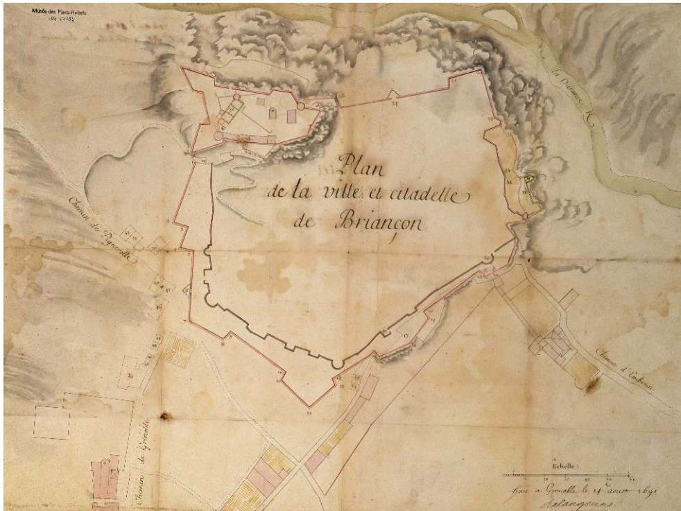
Fig. 2. - Plan de l'enceinte urbaine de Briançon en 1691 signé Delangrune.