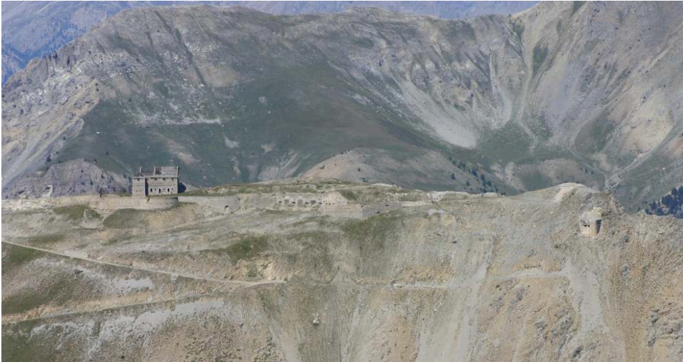
Fig. 8. - Fort Séré de Rivière du Janus.