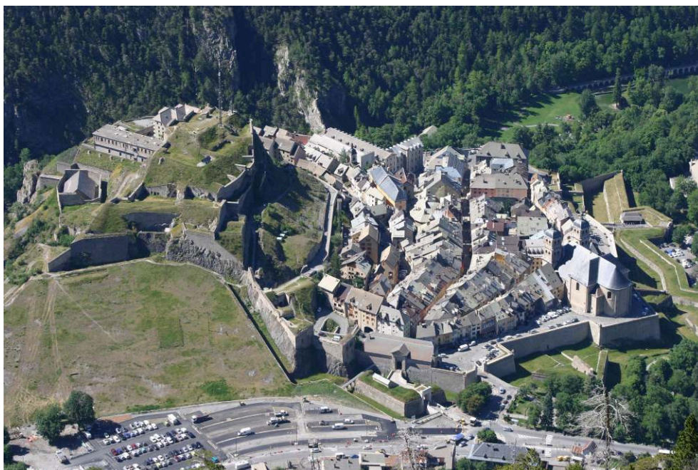
Fig. 5. - Vue aérienne de la ville de Briançon, de son enceinte urbaine, œuvre de Hue de Langrune et de Vauban, et du château royal, entièrement remanié sous la Monarchie de Juillet.