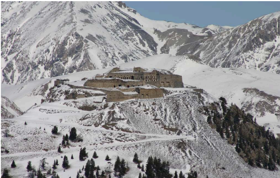
Fig. 7. - Fort de l'Infernet.