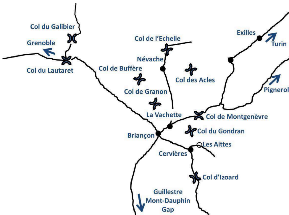
Fig. 1. - Schéma général de situation.

« Ce château était bâti sur une montagne assez haute, avec un grand donjon, le tout de la longueur de vingt-six toises [...] plus qu'au milieu du donjon, il y avait une tour carrée de la hauteur de douze toises [...] plus que la ville était fermée de murailles formant dix bastions ; qu'elle avait encore pour enceinte la rivière de la Durance et un grand roche. » 6