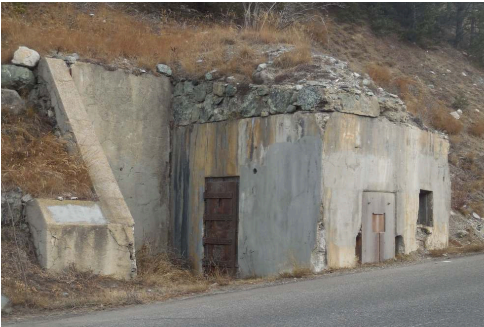
Fig. 10. - Barrage rapide de Montgenèvre.