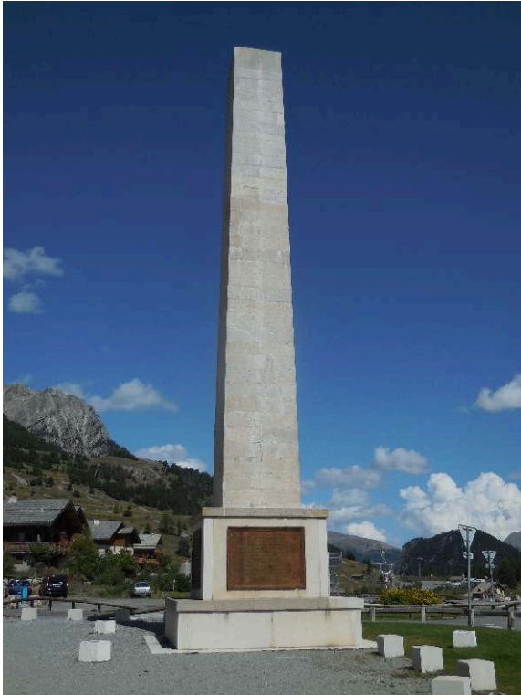
Fig. 6. - Obélisque de Montgenèvre.