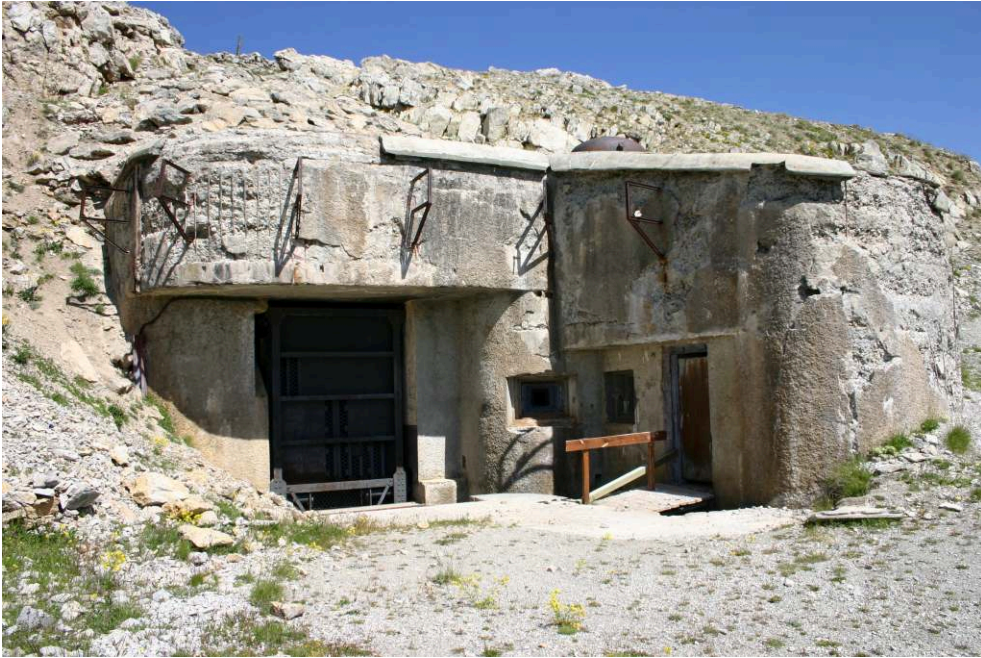
Fig. 9. - Ouvrage Maginot du Janus.