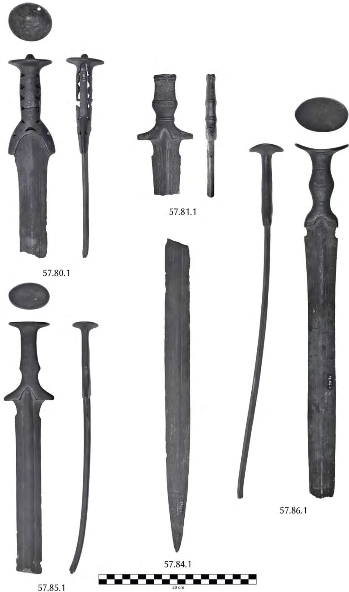
Fig. 1 : Les épées à poignée métallique de provenance inconnue conservées au Musée Bargoin de Clermont-Ferrand.