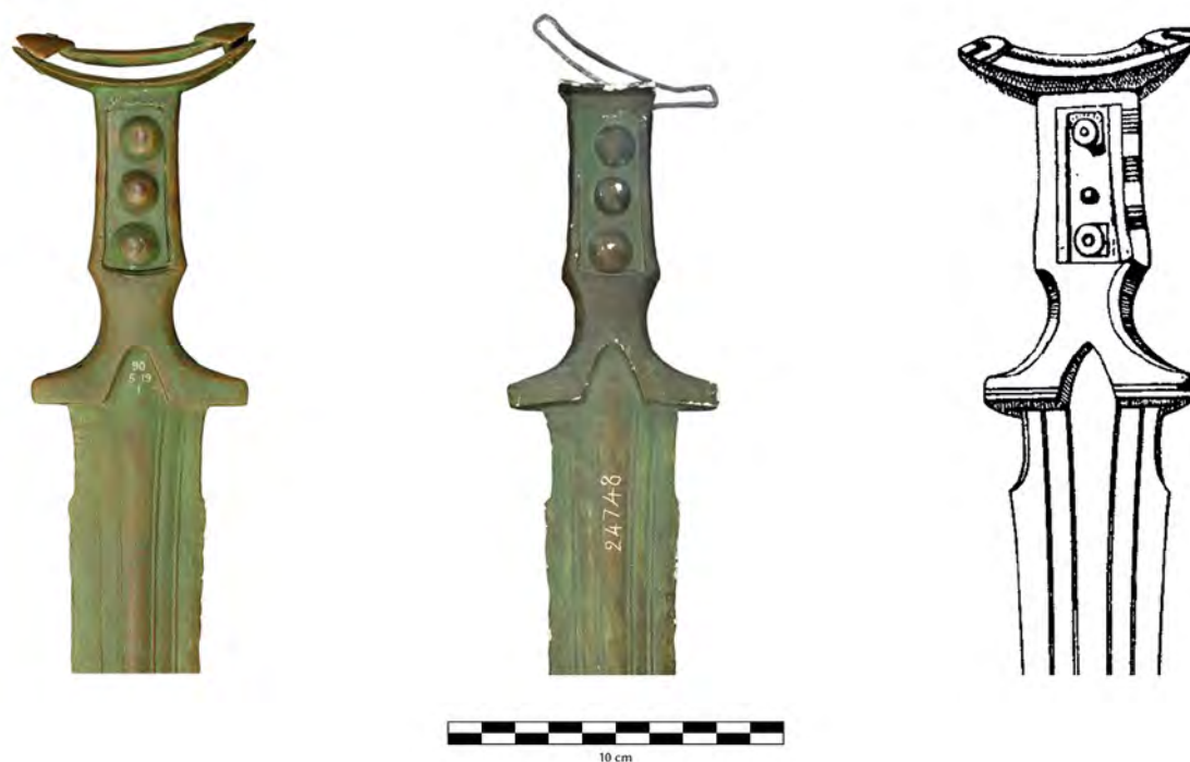
Fig. 4 : Comparaisons entre différents états de la poignée de l'épée du type Tachlovice du dépôt d'Aliès. À gauche : état actuel. Au centre : moulage en plâtre du MAN (n° 24748). À droite : planche de 1872 (d'après Rames 1872)

binson. L'épée est aujourd'hui toujours conservée au sein de l'institution londonnienne, sous le numéro d'inventaire 1890,5-19.1. Son état actuel présente un certain nombre de différences par rapport à la représentation qui en est faite en 1872 (fig. 3, 2 ; fig. 4). La fusée apparaît en effet bien plus fine sur l'épée conservée au British Museum que sur la planche de J.-B. Rames. Le cartouche paraît avoir subi des modifications, avec l'ajout du rivet central, qui était apparemment manquant lorsque l'arme a été découverte, et possiblement la « restauration » de la garniture de la fusée avec la mise en place d'une plaque métallique à cet emplacement. Le moulage du MAN, réalisé en 1878, montre que ces modifications avaient déjà été réalisées alors que l'arme était entre les mains du collectionneur Jules Charvet (fig. 4). La lettre de Salomon Reinach au conservateur du British Museum en date du 16 janvier 1890 indique que Charvet était considéré comme « notoirement peu scrupuleux » et qu'Alexandre Bertrand, alors directeur du Musée des Antiquités Nationales, suspectait que cette arme ne soit en réalité qu'un tirage réalisé à partir de la planche de 1872 plutôt que l'originale. S'il apparaît clairement que la poignée de cette arme a effectivement subi des restaurations, particulièrement au niveau de la fusée, rien ne laisse aujourd'hui suspecter qu'il puisse s'agir d'un faux. Par ailleurs, la différence constatée quant à la largeur de la fusée vient vraisemblablement de la planche