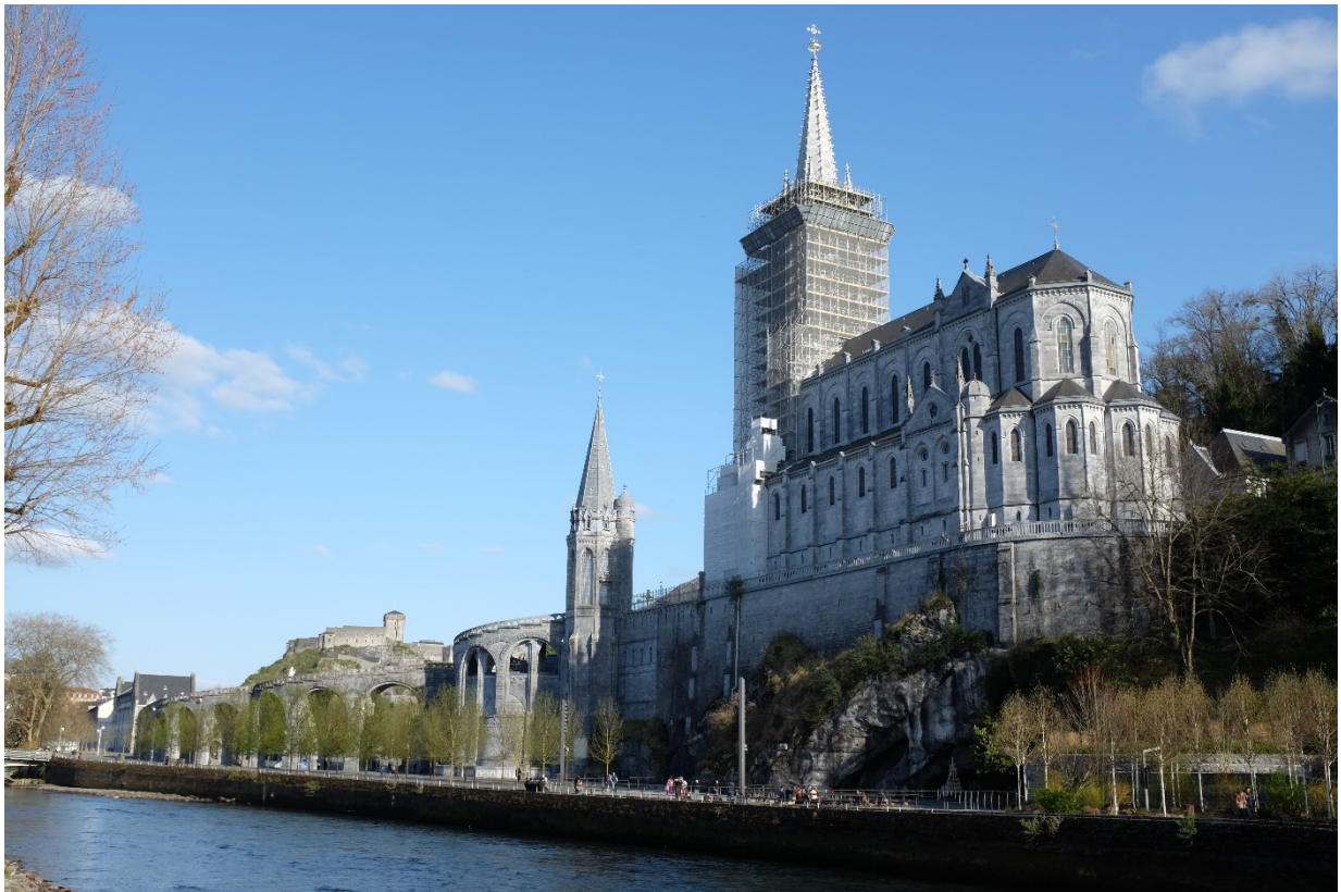
Figure 1 : Sanctuaire Notre Dame de Lourdes, 27 mars 2021