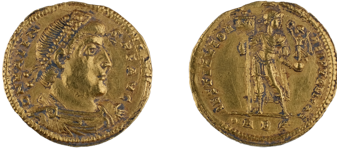
Figure 2 – Solidus de Valens, musée de la Prinerie (© Michel Petit - Communauté d'Agglomération du Grand Verdun ; × 2).

Ce type est très classique et a été frappé pour les empereurs – et frères – Valentinien I er et Valens, pendant la plus grande partie du règne, mais principalement entre 364 et 367 par l'atelier de Rome. Pour cette émission, l'atelier fonctionne avec quatre officines (P, B, T et Q), la marque étant précédée d'un globule et suivie d'une palme. Les officines P et T frappaient pour Valentinien I er et B et Q pour Valens. Cependant, G. Depeyrot signale un exemplaire de la 4 e officine conservé à Trèves pour Valentinien I er et un exemplaire de Valens pour la troisième officine qui se trouve à Leiden 10 .