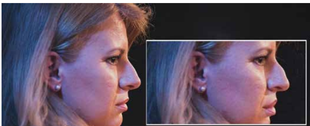
Obrázok 2: Upravená fotografia Zuzany Čaputovej 41)

Čo sa týka modi operandi tvorby nepravdivých a zavádzajúcich informácií, aktéri samozrejme nevytvárajú vždy nový obsah, ale častokrát s menšími alebo väčšími úpravami len preberajú obsah zo zahraničia. V rámci kategorizácie možno teda hovoriť o obsahu primárne domácej alebo zahraničnej provinencie. Príkladom prvej kategórie je napríklad zámerne upravená fotka z roku 2019 (obrázok 2), na ktorej je vtedajšia prezidentská kandidátka Zuzana Čaputová. Časopis Zem a Vek, ktorý fotku upravil a použil spolu s textom o liberálnom zle na nej Z. Čaputovej zakrivil nos a upravil pery spôsobom pripomínajúcim antisemitskú propagandu, ktorej cieľom bolo poukazovať na „židovské črty“.