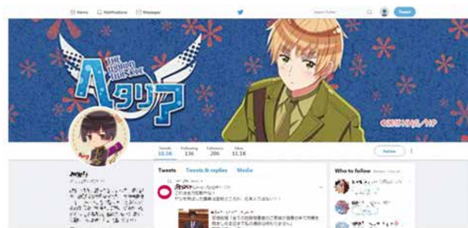
Obrázok 4: Bot aktívny počas japonských volieb v roku 2017 44)

sieťové služby. Tie posledné pritom predstavujú silnú živnú pôdu pre aktérov zámerne tvoriacich a šíriacich nepravdivý a zavádzajúci obsah, ktorí využívajú spôsob fungovania SSS na amplifikáciu svojho obsahu. V rámci amplifikačných ciest na SSS možno hovoriť o polo/automatizovaných a manuálnych prístupoch. K prvému uvádzanému možno napríklad priradiť možnosť zaplatenia reklamy na daný príspevok. Ďalším populárnym nástrojom z tejto kategórie sú boty, t. j. softvérové programy, ktoré automaticky dokážu zdieľať príspevok obsahujúci isté kľúčové slová, pričom už technicky priemerne zdatný človek dokáže vytvoriť stovky, resp. aj tisíce takýchto botov. Z viacerých výskumov, primárne na sociálnej sieťovej službe Twitter, vyplýva, že boty sú obľúbeným nástrojom, ktorý je využívaný napríklad počas predvolebných kampaní vo viacerých štátoch sveta. 43) Ilustráciou môže byť bot aktívny počas japonských volieb v roku 2017 (obrázok 4). Nie na každú situáciu je však vhodné využiť automatizované prístupy amplifikácie, nakoľko tieto sú relatívne ľahko detekovateľné a vypátratelné.