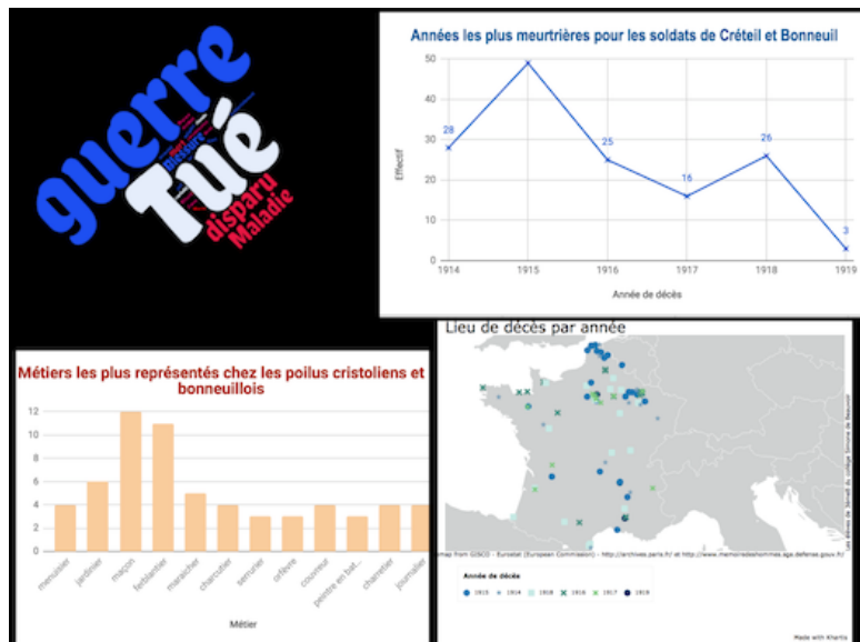
Fig. 1. Extrait de la production du Collège Simone de Beauvoir de Créteil, publiée sur le site data.gouv.fr, comme cas d'utilisation du jeu de données.

interactive comportant les visualisations produites, et en bande son des témoignages des élèves répondant à des questions sur leurs activités et leurs résultats (v. tableau 1) 5 .