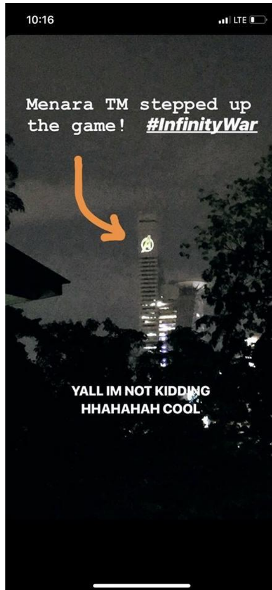
ILLUSTRATION 4 : Photographie de portable retouchée montrant la Tour Menara TM Tower, 2012.

Entre super-héros, paysage urbain et mondialisation de la culture, l'édifice imaginaire devient un bâtiment, mais aussi un site touristique employant comme élément promotionnel pour les films Avengers , un logo correspondant à l'univers Marvel, le A de Avengers.