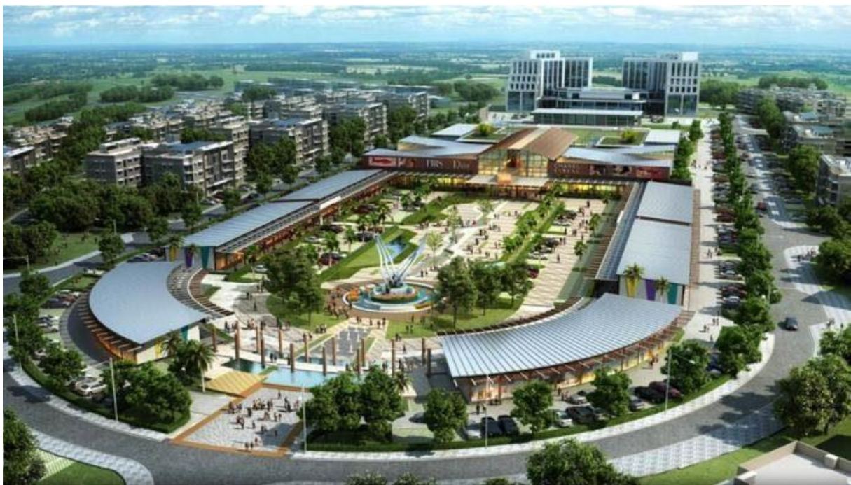
ILLUSTRATION 5 : Wakanda smart city au Rwanda 2029, État africain et projet d'une ville de plus de 35 000 habitants. Gouvernement rwandais.

bâtiments par des raccourcis reposant sur la physionomie et la ressemblance aux premiers abords, avec la Bitexco Financial Tower à Hô Chi Minh-Ville (Saïgon) au Vietnam, les articles de la presse locale voire internationaux peu sérieux font tout de suite l'assimilation entre le film Avengers et la Tour Stark : « le bâtiment qui aurait servi ou bien a servi de modèle pour le film » xix , il en est de même de visiteur remarquant une ressemblance du paysage urbain, ceci devenant parfois viral dans le domaine des réseaux sociaux. À cela, le fait de voir apparaître des projets comme Wakanda Smart City au Rwanda nous fait entrevoir que les films impulsent aussi des imaginaires et des correspondances aisées ou faciles pour les populations locales et certains dirigeants africains voulant créer leur propre utopie comme récemment au Sénégal avec le célèbre chanteur Akon devenu promoteur immobilier xx .