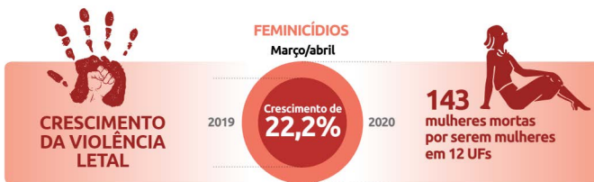
Fig. 1. 29

El aumento de femicidios en la pandemia del COVID-19