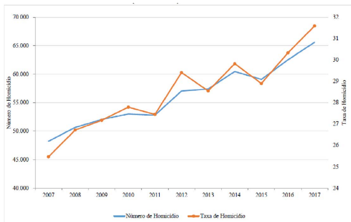
Gráfico 1. Brasil – número y tasa de homicidios (2007-2017)

Los datos nos muestran cómo el nombrar el crimen de femicidio es una manera de sacarlo de la invisibilidad. La edición actual del Atlas de la Violencia 2019 4 comprende los datos de 2007 a 2017 con relación a la violencia en territorio brasileño; y los números no son buenos, de hecho. Desde luego, sabemos del más elevado nivel histórico de letalidad violenta intencional en el país, así destacado en el siguiente gráfico: