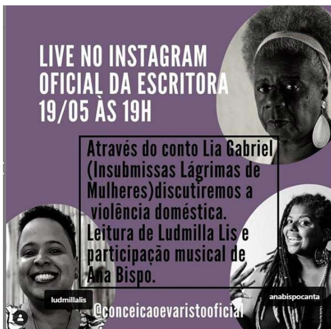
Fig. 3. Anuncio del programa en vivo en Instagram sobre el cuento “Lia Gabriel”, de Conceição Evaristo