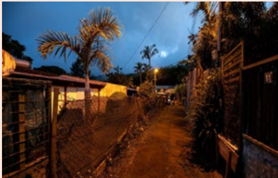
Parcours commenté nocturne avec des habitants de La Plaine des Palmistes.