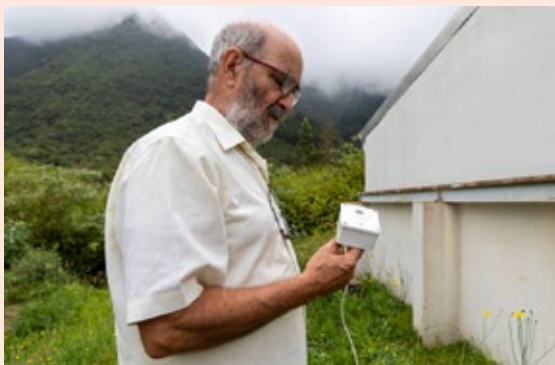
Installation d'un photomètre TESS-W à l'Observatoire astronomique des Makes dans le cadre du déploiement d'un réseau de capteurs pour le suivi long terme de la pression lumineuse sur l'île.