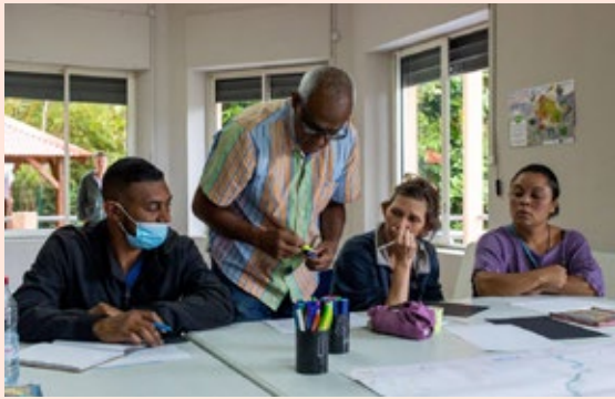
Atelier habitants dans le quartier du Brûlé (commune de Saint-Denis).