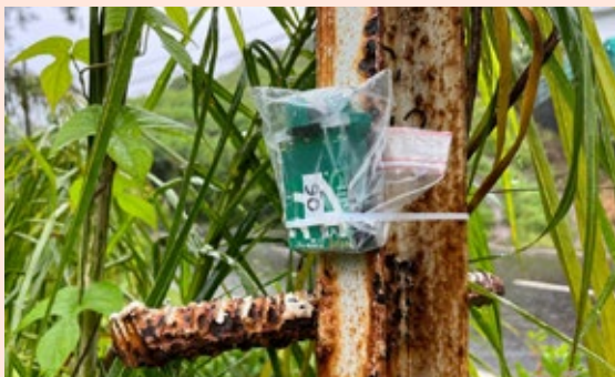
Enregistreur bioacoustique installé dans la commune de Saint-Joseph lors d'une expérimentation visant à étudier les effets de l'extinction de l'éclairage public sur l'utilisation des paysages par les chiroptères.

Fig.2. L'interdisciplinarité et la participation sont au fondement des démarches de recherche et de recherche interventionnelle déployées par les chercheurs de l'Observatoire de l'environnement nocturne pour un rapprochement des expertises scientifiques, techniques et d'usage, ici dans le cadre du programme pluriannuel FENOIR, à La Réunion.