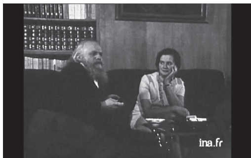
FIGURE 1 • « Portrait de deux musicologues », Micros et caméras, 14 mars 1970, première chaîne de l'ORTF.