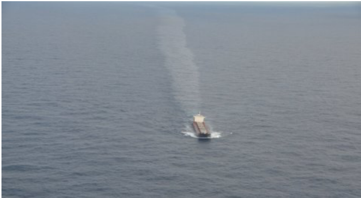
Pollution navire Thisseas

La cour d'appel de Rennes avait considéré que l'article 228 de la Convention soumettait la poursuite en France à un certain nombre de conditions préalables, dont il appartenait au juge répressif de déterminer si elles ont été ou non remplies, ce qui impliquait l'analyse de la réponse donnée par l'Etat français à la demande émanant de l'Etat étranger.