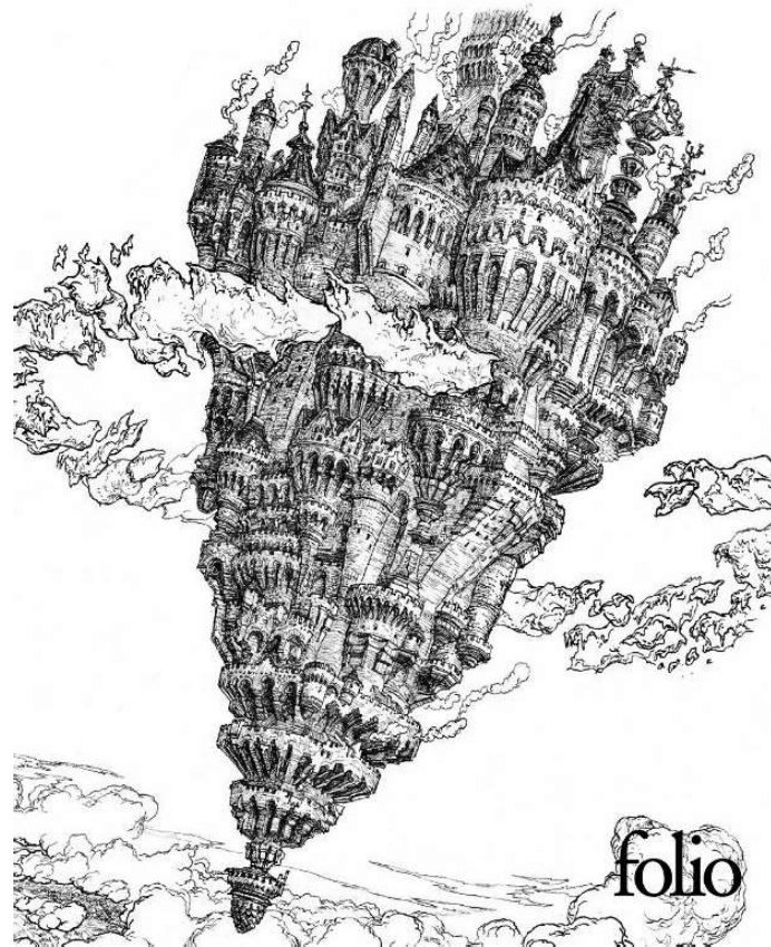
Figure 5.1 : Couverture de La Passe-miroir (Gapaillard, 2016).

À la Citacielle, les constructions ont entièrement dévoré l'île, qui est représentée dans cette couverture comme un gigantesque château volant au caractère médiéval, caractère que l'on perçoit déjà dans les tours des Chroniques du bout du monde et qui semble évoquer une nostalgie du passé tout en rappelant les codes de la fantasy et en plongeant les lecteurs et lectrices dans une atmosphère merveilleuse. Cette adaptation de la Citacielle à l'environnement est avant tout une domination de l'espace qui place l'humain en créateur absolu, voire divin. En considérant l'œkoumène non plus uniquement comme un « espace habitable de la surface terrestre » (Œkoumène, s.d.), mais comme l'en-