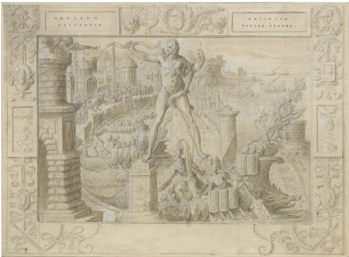
Fig. 1 : Antoine Caron, La prise de Rhodes , après 1566, pierre noire, plume et encre brune, lavis, rehauts de gouache, 406x551 mm, Paris, BnF, Estampes, Rés. AD-105-FT 4, f° 21 r°.