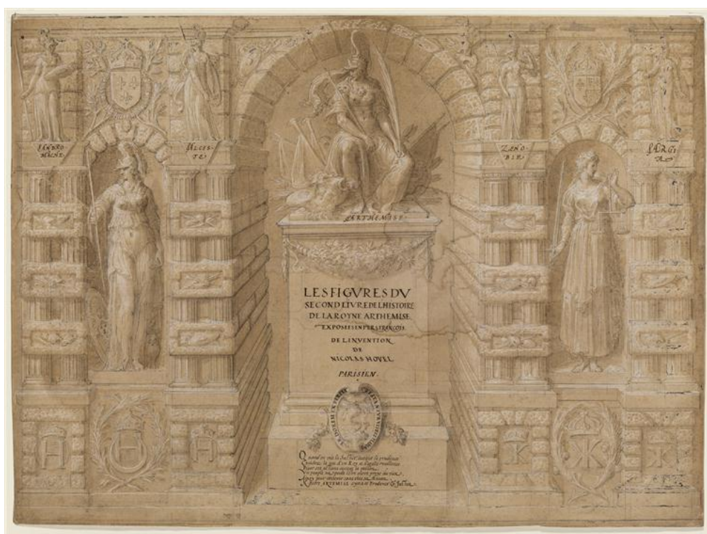
Fig. 3 : Antoine Caron, Frontispice du second livre de l'histoire de la reine Artémise , pierre noire, plume et encre brune, lavis, rehauts de gouache, 410x557 mm, Paris, musée du Louvre, Arts graphiques, RF 29728.BIS1