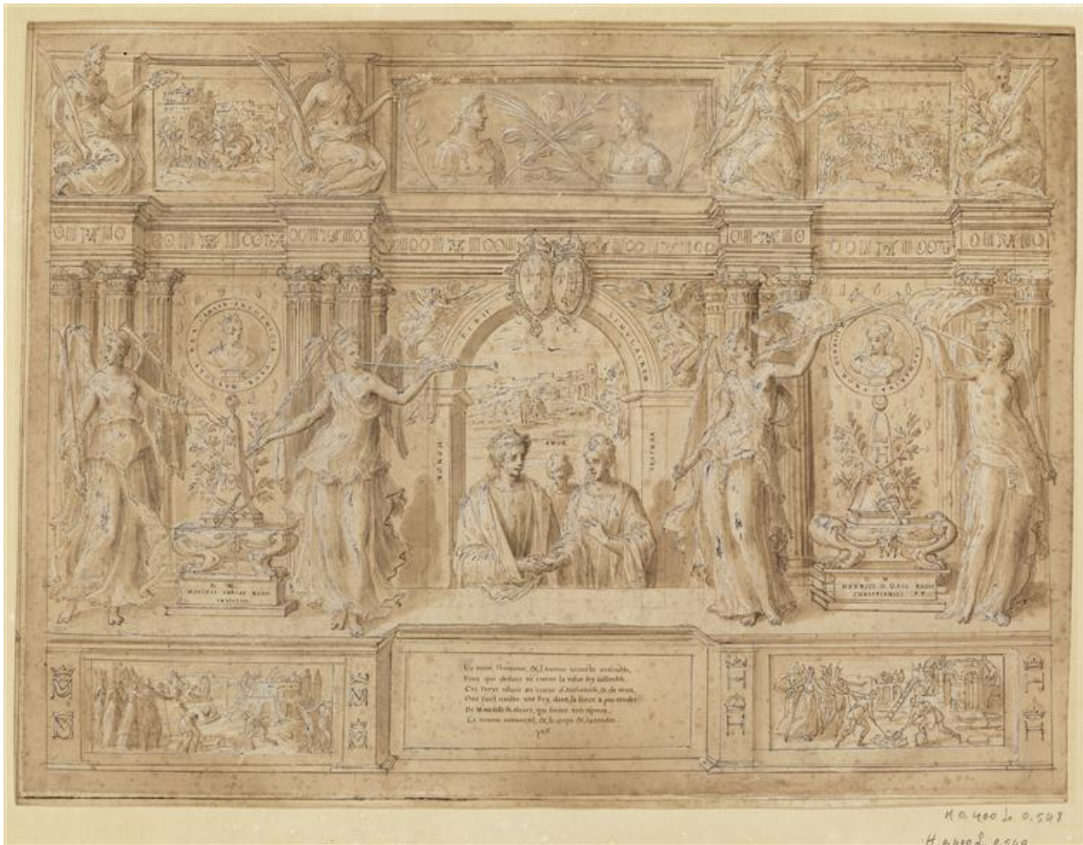
Fig. 7 : Antoine Caron, Fidei Simulacrum , plume et encre brune, lavis, rehauts de gouache, 414x556 mm, Paris, musée du Louvre, Arts graphiques, RF 29752.7