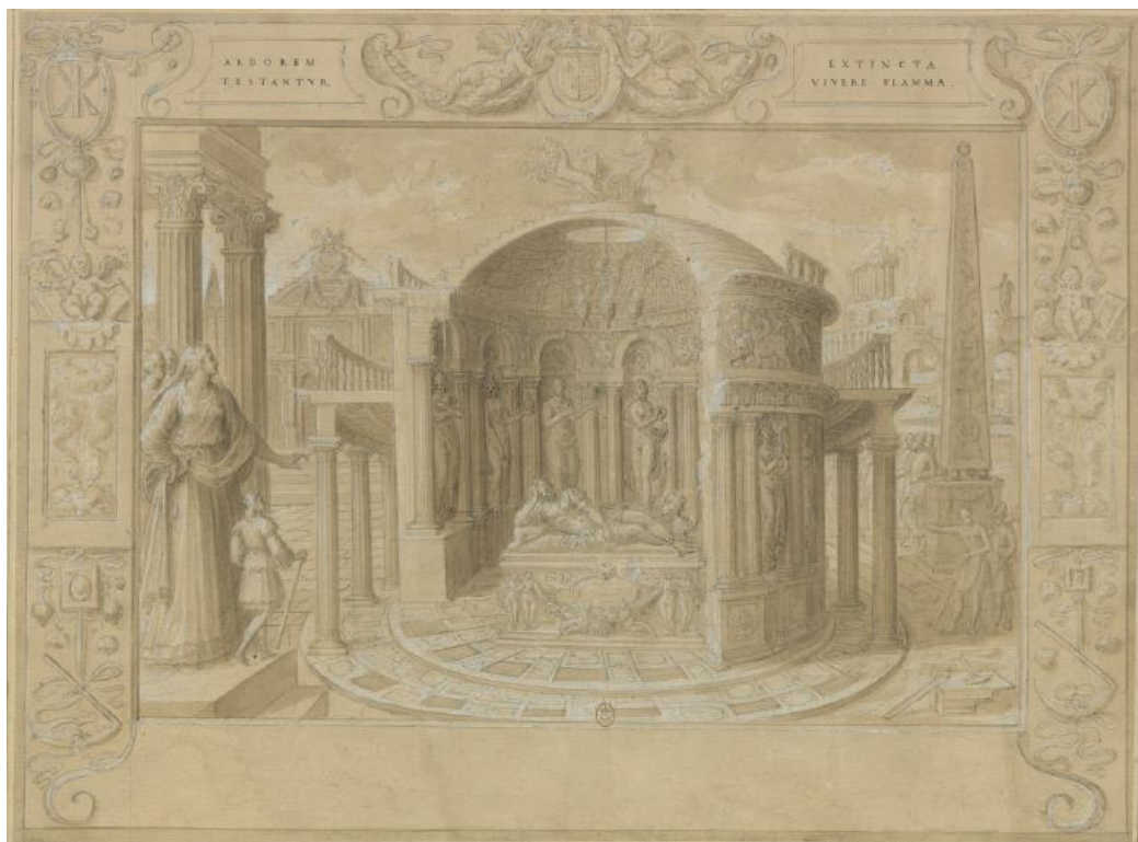
Fig. 2 : Antoine Caron, Le Mausolée d'Halicarnasse , après 1566, plume et encre brune, lavis, rehauts de gouache, 407x546 mm, Paris, BnF, Estampes, Rés. AD-105-FT 4, f° 43 r°.