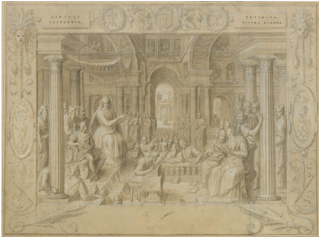
Fig. 4 : Antoine Caron, L'Assemblée des Etats , après 1566, pierre noire, plume et encre brune, lavis, rehauts de gouache, 407x458 mm, Paris, BnF Estampes, Rés. AD-105-FT 4, f° 17 r°.