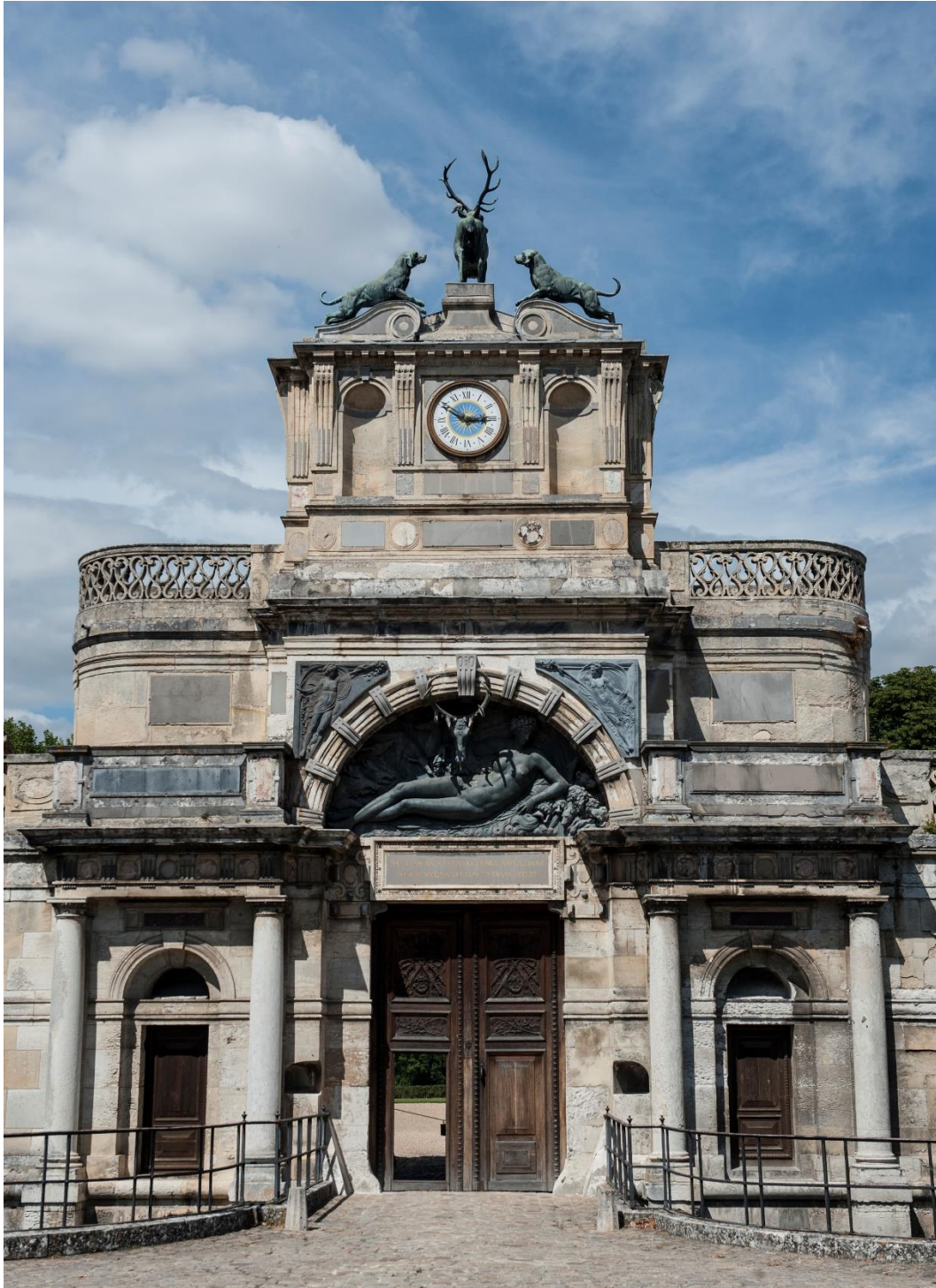
Fig. 6 : Château d'Anet (Eure-et-Loir), corps d'entrée, face extérieure.