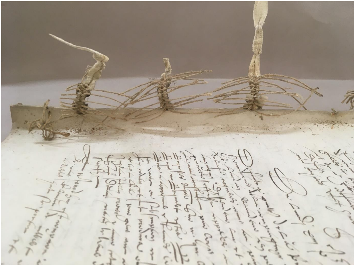
Aperçu de la structure de la couture en cours de démontage, évoquant un squelette – Z/1c/1

La couture à chevrons, observée sur nos registres de la connétablie et sur beaucoup d'autres volumes reliés à la même époque, ajoute un troisième point d'ancrage aux deux premiers. Elle permet de solidariser le cahier au précédent non plus exclusivement par les points de chaînette, mais également par chacun des supports 6 . Si cette opération apporte indubitablement une solidité supplémentaire, elle présente l'inconvénient de tirer chacun des cahiers en arrière, vers le cahier précédent auquel il est rattaché. Distribué sur l'ensemble du dos, ce mouvement peut provoquer une inversion de la courbure convexe recherchée du dos. Plus les cahiers sont épais, plus cette contrainte est importante, puisque la distance parcourue par le fil pour rejoindre le cahier précédent est plus grande. Une couture à chevrons effectuée sur un volume dont les cahiers sont épais aura donc plus de chances de passer de convexe à concave.