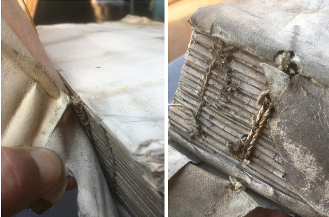
Clou visible dans l'un des supports de couture d'un registre (à gauche) et traces d'oxydation ferreuse dans le support d'un autre – Z/1c/14 et Z/1c/39

Cette expérience démontre deux choses : premièrement, les interventions de conservation-restauration sont des occasions uniques et précieuses d'étudier la matérialité du patrimoine écrit et l'histoire des techniques 11 ; et deuxièmement, il est nécessaire de questionner en permanence nos connaissances et nos intuitions en matière de techniques anciennes de reliure et de restauration 12 .