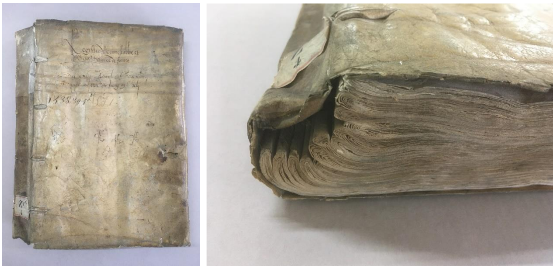
Aperçu de l’un des registres du fonds Z/1c à son arrivée à l’atelier : plat supérieur (à gauche) et tranche de queue (à droite) – Z/1c/4

C’est dans le cadre de ces chantiers de préparation à la numérisation que quelques registres de la série Z/1c sont arrivés à l’atelier de reliure et de restauration des Archives nationales. Ce fonds est constitué d’un peu moins de 500 registres. Entré aux Archives en 1847, il regroupe les papiers de la connétablie et de la maréchaussée de France depuis le X IV e siècle jusqu’à la Révolution française 2 . Seuls quatre registres du fonds, datés de 1528 à 1538, sont actuellement pris en charge par l’atelier de Paris (Z/1c/1 à Z/1c/4). Chacun de ces quatre volumes représente de nombreuses heures de travail, si bien que leur traitement doit être étalé sur une longue période.