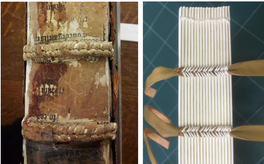
Une couture ancienne à chevrons avec renfort du dos par des claires en parchemin (à gauche), et une couture similaire effectuée de nos jours (à droite) – LL//1068

Une couture à chevrons, des cahiers épais, et aucune apprêturation : toutes les conditions pour que le dos passe de convexe à concave semblent être réunies sur certains des registres de la connétablie déposés à l'atelier. L'un d'eux – dont j'ai hérité – présentait des déformations si importantes qu'il a été décidé de défaire la couture avant de traiter les feuillets un à un, puis de réaliser une nouvelle couture plus adaptée aux cahiers épais.