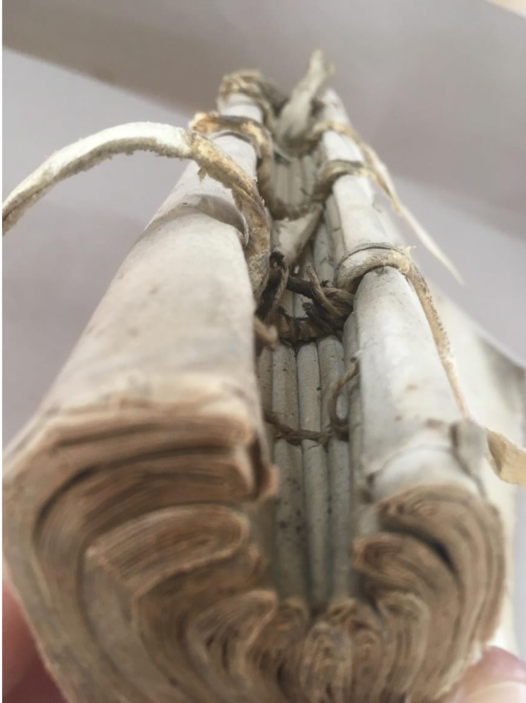
Déformation ou incurvation du dos, qui est passé de convexe à concave – Z/1c/1

Véritable pilier du livre, la couture détermine toutes les opérations de reliure, celles qui la précèdent comme celles qui la suivent. Comme souvent dans le monde de l'artisanat, le terme « couture » désigne à la fois une opération et son résultat. Le procédé a deux objectifs : permettre de lier les cahiers les uns aux autres via le point de chaînette ; et attacher chacun de ces cahiers aux supports préalablement préparés 5 . C'est d'ailleurs l'opération qui consiste à passer – après couture – les supports dans des trous percés dans les plats qui différencie une reliure d'un emboîtement. Le terme reliure désigne l'opération qui consiste à relier les supports de couture aux plats. En résumé, si le livre relié était un corps humain, les supports de la couture seraient les vertèbres constituant ensemble la colonne vertébrale, le fil de couture serait la structure osseuse, et les cahiers seraient les muscles.