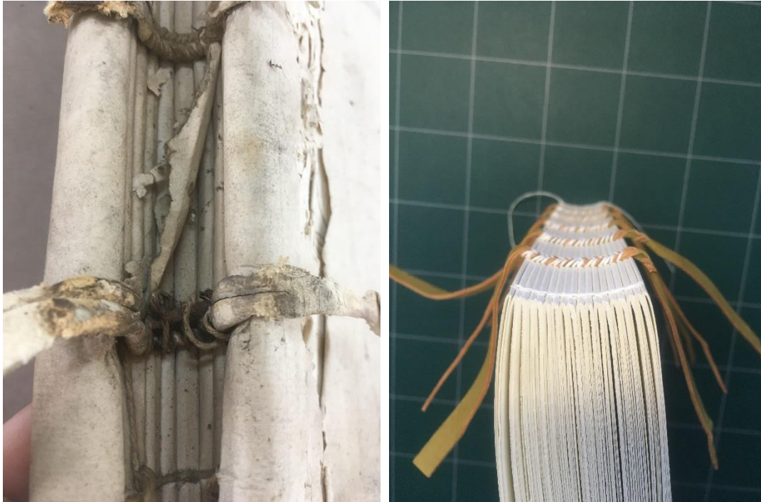
Incurvation du dos sur un registre du XVIe siècle (à gauche), et déjà visible sur le même type de couture effectuée de nos jours (à droite) – Z/1c/1

A chaque ouverture d'un volume, le dos passe de convexe à concave, puis de concave à convexe lorsque le livre est refermé 7 . Maintenir cette forme convexe lorsque l'ouvrage est fermé est l'un des enjeux mécaniques les plus importants de la reliure 8 . Le rôle primordial joué par la couture est secondé par d'autres opérations. L'endossure dite « à la française », pratiquée du XVIe au XIXe siècle environ 9 , consiste à tenter de bloquer cette forme convexe en forçant le passage des supports de couture dans les plats 10 . Le collage de morceaux de papier ou de parchemin – appelés claires ou apprêture – sur le dos vise à le solidifier, tout en maintenant une certaine souplesse permettant l'ouverture.