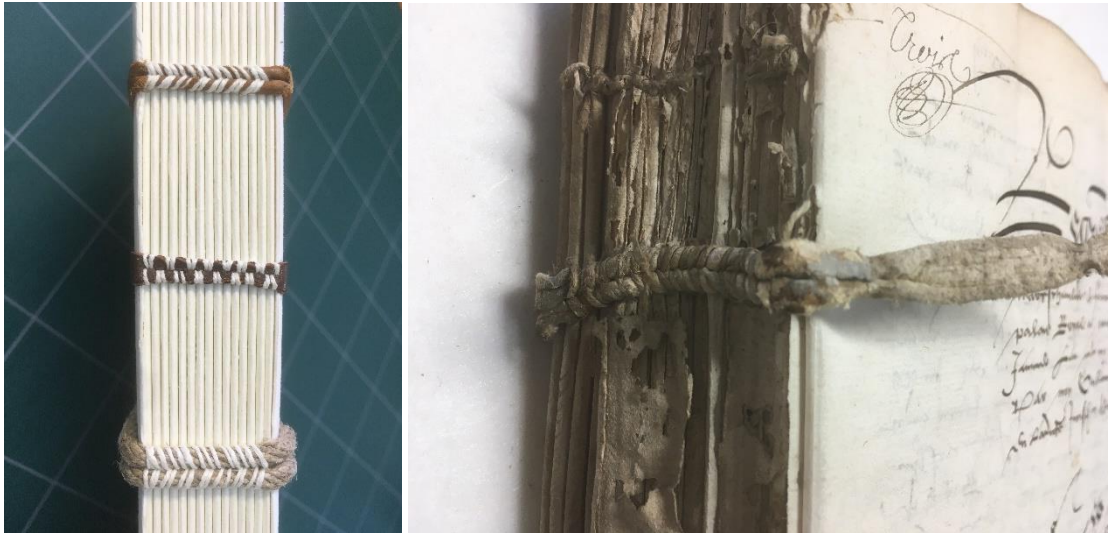
Quelques exemples de coutures sur doubles nerfs (à gauche), et une couture ancienne sur doubles lanières à chevrons (à droite) – Z/1c/3

Une couture à chevrons, des cahiers épais, et aucune apprêturation : toutes les conditions pour que le dos passe de convexe à concave semblent être réunies sur certains des registres de la connétablie déposés à l'atelier. L'un d'eux – dont j'ai hérité – présentait des déformations si importantes qu'il a été décidé de défaire la couture avant de traiter les feuillets un à un, puis de réaliser une nouvelle couture plus adaptée aux cahiers épais.