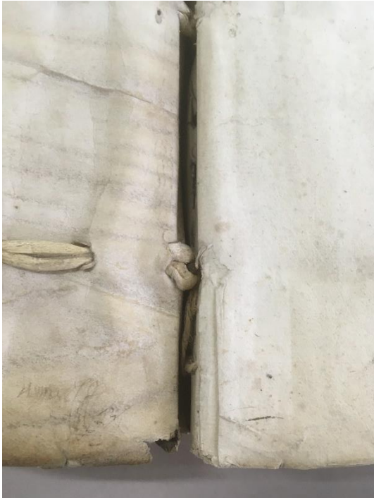
Passure des lanières de cuir mégissé dans la couverture de parchemin – Z/1c/4

Ainsi, même si ce type de structure – souvent appelée « reliure à la hollandaise » – peut sembler relever du niveau zéro de la reliure, elle présente une certaine solidité qui a participé à la transmission du volume de jusqu'à nous 3 . Elle est d'ailleurs largement utilisée du XVe jusqu'au XIXe siècle, et on l'a souvent qualifiée à tort de reliure d'attente 4 .