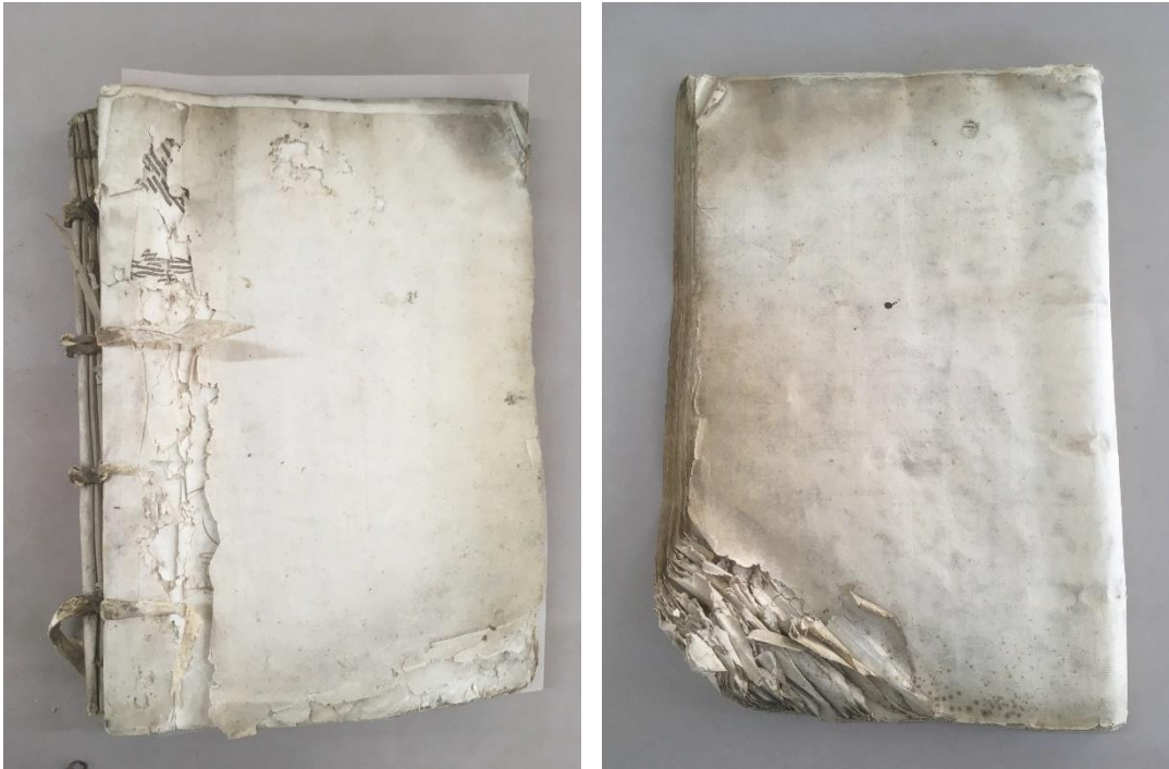
Aperçu de l'état matériel des feuillets du registre dont j'ai hérité : affaiblissement et déformations – Z/1c/1

exposés à une humidité très élevée sur une longue période. Cette humidité couplée à un conditionnement souvent inadéquat a eu pour conséquences d'importantes déformations des feuillets ; ainsi qu'une perte conséquente de la charge en colle du papier, qui a permis le développement de microorganismes et qui a considérablement affaibli le support. L'intervention de conservation-restauration en vue de la numérisation a donc un objectif double : renforcer le support papier d'une part, et lui rendre une certaine planéité d'autre part. Ce traitement, long et répétitif, s'inscrit a priori dans la catégorie des travaux rébarbatifs évoqués plus haut.