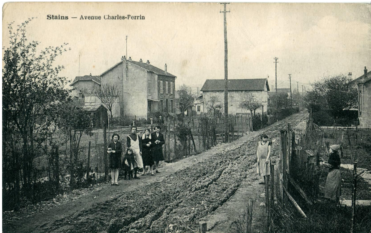
3. Lotissement défectueux à Stains, Avenue Charles Perrin (93), non viabilisé et sans voie d'accès stabilisée. (Carte postale éditée par Bouchetal, entre-deux-guerres)