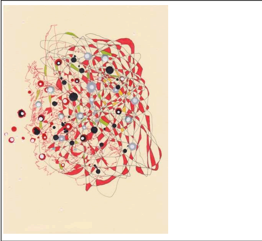
Fig. 6. Touch Receptors 0073

Medio mixto sobre papel, 30.48 cm x 21.59 cm, 2020.