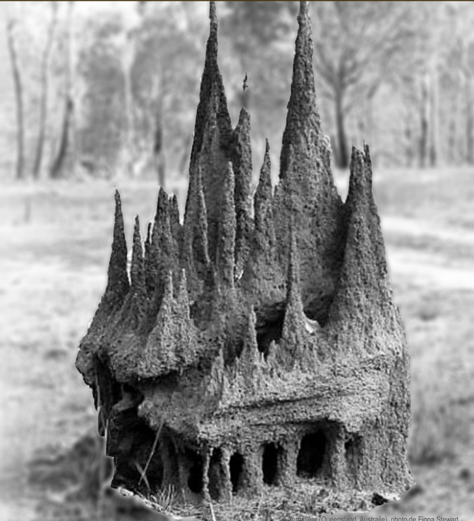
Termitière (Queensland, Australie)