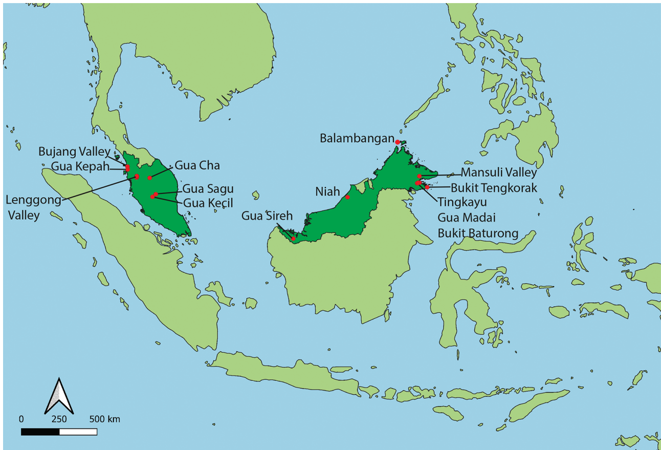
Fig. 1 – Principaux gisements archéologiques en Malaisie (D. Codeluppi). Fig. 1 – Main archaeological areas in Malaysia (D. Codeluppi).