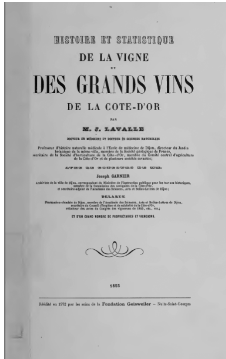
Fig. 2. Première page de l' Histoire et statistique de la vigne et des grands vins de la Côte d'Or (1855).