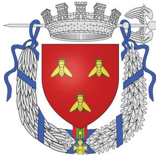
VILLE DE GIVORS