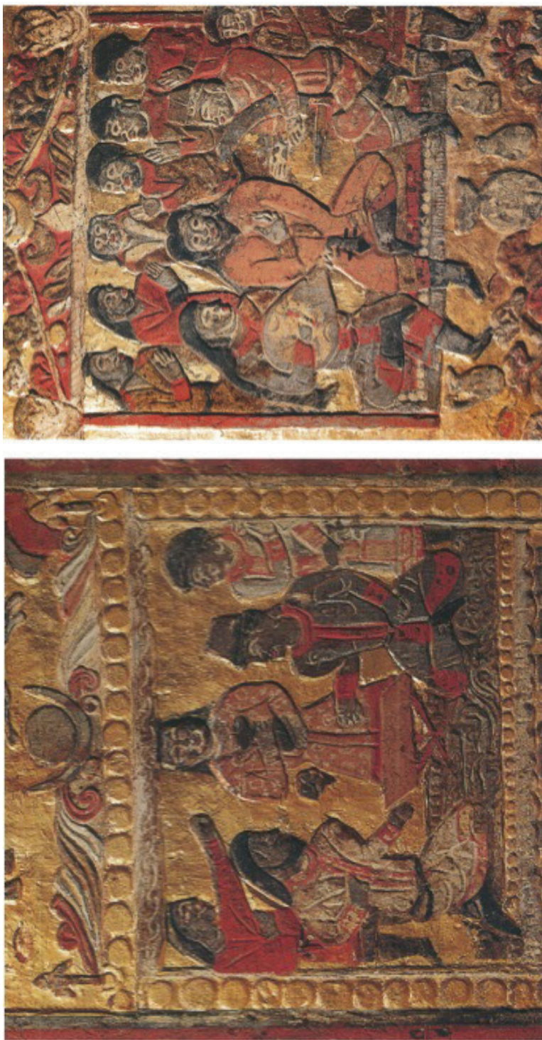
FIG. 1. — Lit funéraire du sabao An Qia, mort en 579 (détail). Musée de Xi'an. ( Anjia tomb of Northern Zhou at Xi'an , Beijing [Wenwu Chubanshe], 2003).