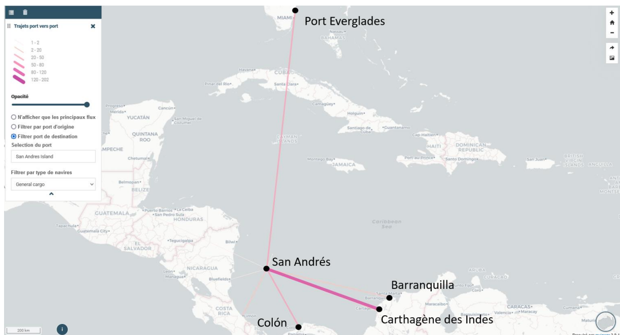
Figure 1 : Trajets pour lesquels San Andrés (Colombie) est la destination, avec les principaux ports d'origine (domestiques et internationaux)

La région des Caraïbes se situe à proximité des États-Unis, qui reste le plus puissant pôle économique de la planète, et entretient des liaisons maritimes soutenues avec les pôles européen et chinois, grâce notamment au Canal de Panama qui fournit un lien stratégique entre Atlantique et Pacifique. Les navires participant à ces échanges internationaux sont le plus souvent adaptés pour le transport de marchandises à longue distance : ils sont généralement spécialisés, de grande taille, et relativement récents, car soumis à des réglementations strictes (cas des porte-conteneurs et de tankers). À l'opposé, le trafic domestique concerne des activités fortement ancrées dans l'espace caribéen, notamment pour la desserte des territoires et des populations insulaires. Les navires utilisés sont souvent de taille modeste, relativement anciens, mais ils sont en contrepartie plus polyvalents et adaptés à des rotations courtes : il s'agit en majorité de petits cargos généralistes et de navires inter-îles de transport de passagers. Ces inter-îles participent dans beaucoup de cas d'un commerce « à la valise », répondant à des besoins bien spécifiques des populations locales et échappant aux statistiques.