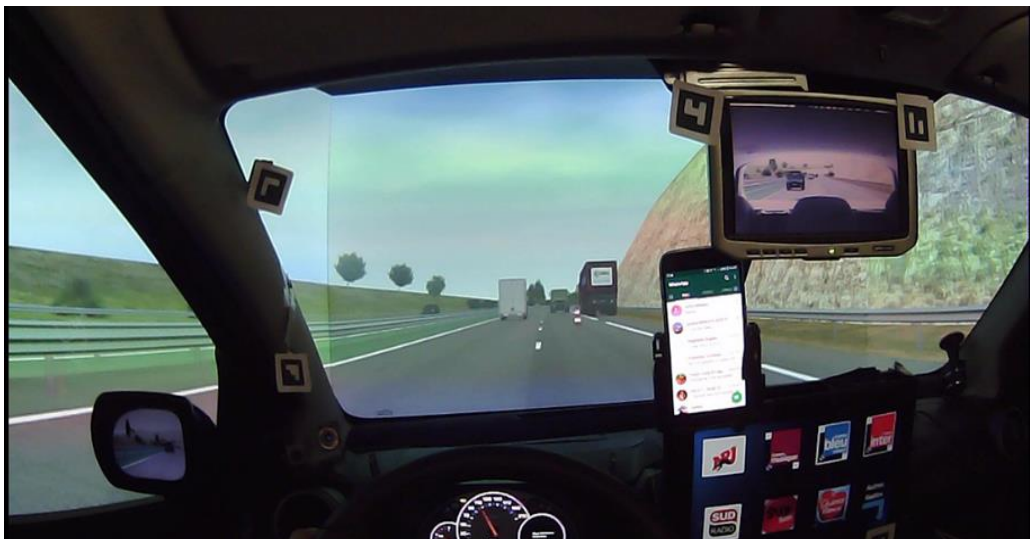
Figure 2 : Situation d'évitement d'obstacle sur autoroute

En hands-off, la distance aux obstacles (plus précisément le temps à l'obstacle combinant distance et vitesse) quand la voiture se déporte sur la voie de droite est inférieure ( p < 0,05 ) par rapport à Hands-on, ce qui signifie que les conducteurs se déportent un peu plus tardivement pour éviter l'obstacle, la réactivité et les marges de sécurité sont donc moindres (temps moyen minimum à l'obstacle de 3 sec. en hands-on et de 2,4 sec. en hands-off). 12