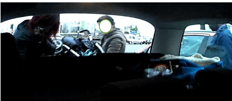
Photo 5 : Le bébé est installé dans son siège-auto, la conductrice range la poussette dans le coffre avec la femme aperçue plus tôt dans la séquence.

Puis Alexia observe que l'homme et la femme s'embrassent et se saluent avant de se quitter (photo 6). Alexia boucle sa ceinture.