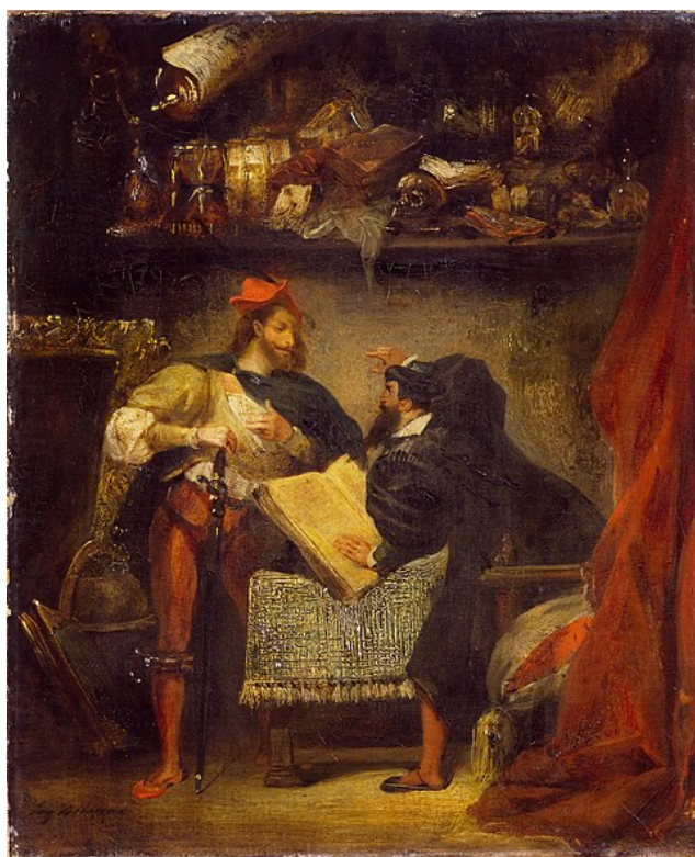
Figure 1 : Faust et Méphistophélès, Eugène Delacroix, 1827 4

A ce stade de notre réflexion, il nous semble important de préciser la chose suivante, les fictions mettant en scène sciences et scientifiques fonctionnent souvent comme un miroir de la société. Prenons un exemple concret : les années 1960 sont le terrain de la transformation des films de science-fiction. A la mode des « films de monstre » et des invasions-extraterrestres, succèdent les angoisses de la guerre froide portées à l'écran. De science-fiction, on passe à un cinéma d'extrapolation scientifique. Les postulats initiaux des films deviennent de plus en plus plausibles, et en un sens le cinéma, dans une forme de parallélisme, se fait le reflet des problèmes du monde. Cette idée n'est d'ailleurs pas propre au