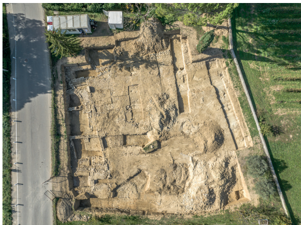
Vue d'ensemble du site de l'avenue Sautel avec, à gauche, les constructions de l'Antiquité tardive

Une fouille réalisée en 2022 aux environs des Thermes du Nord a permis de mieux cerner la limite nord de la ville antique qui se matérialise ici par le carrefour de deux voies, l'une venant de l'est et l'autre du nord, réaménagé à plusieurs reprises.