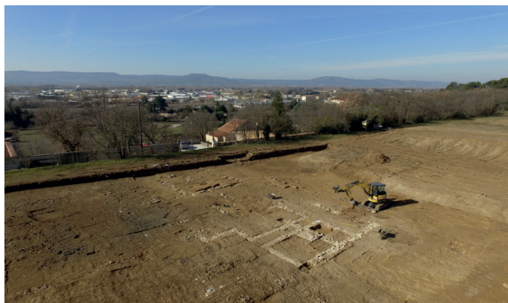
vue aérienne du site fouillé

En périphérie sud-est de la ville de Pertuis, une fouille conduite en 2019 a mis au jour les vestiges d'un établissement rural antique sur une superficie de 8000 m 2 , placé sur le rebord d'une terrasse dominant la vallée de la Durance.