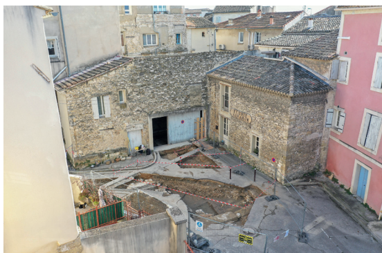
Vue de la fouille en cours de la synagogue moderne de L'Isle-sur-la-Sorgue

Emilie PORCHER (Direction du Patrimoine de L'Isle-sur-la-Sorgue)