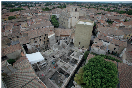
Vue d'ensemble de la fouille du site de la Tour d'Argent en 2022

conservation de certains bâtiments et orienté les architectes dans leurs projets de restauration. Ici, l'archéologie n'est pas perçue comme une contrainte mais telle une opportunité pour développer un projet qualitatif de restauration immobilière. Au-delà de cet aspect, les recherches sur ce site ont véritablement révélé l'histoire de L'Isle et alimenté notre réflexion sur la société médiévale avant l'arrivée des papes dans cette région du Comtat Venaissin. Nous verrons au travers d'un panel d'études archéologiques, développé depuis dix ans, des résultats significatifs concernant l'origine de la ville, la mise en place d'un véritable quartier aristocratique entre les XIIe et XIIIe siècles et enfin sa persistance jusqu'au XIXe siècle.