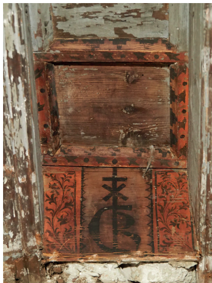
Découverte d'un closoir d'un plafond peint portant la signature d'un marchand

Cette étude de bâti, couplée à une étude archivistique, a permis de restituer l'évolution du bâti de deux hôtels particuliers situés dans le cœur économique de la cité des Papes depuis le XIIIe siècle jusqu'à l'époque contemporaine. Etant donné le caractère exceptionnel des décors peints, une procédure de classement Monument Historique est en cours.