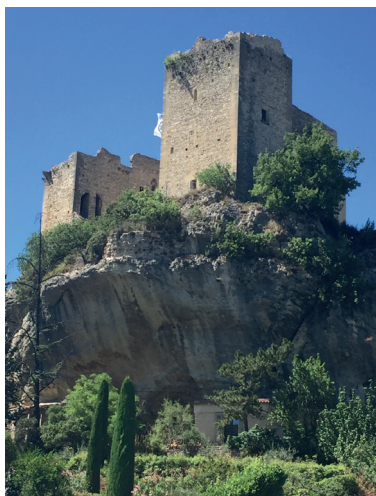
Vue du château