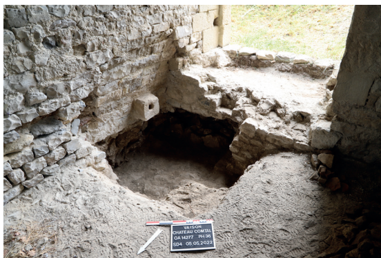
Négatif d'une cuve destinée à recueillir le jus de raisin aménagée dans le sol du cellier situé en rez-de-chaussée du château comtal de Vaison-la-Romaine

Durant l'époque médiévale, l'agglomération vaisonnaise a connu une évolution topographique importante en lien avec le conflit entre les évêques de Vaison et les comtes de Toulouse ayant motivé la construction du château par ces derniers au cours du dernier quart du XII e siècle. Perché sur la colline en rive sud de l'Ouvèze et entouré de son enceinte fortifiée, cet élément symbolique de la période médiévale que constitue le château a fait l'objet d'un diagnostic d'archéologie préventive réalisé par le Service d'Archéologie du Département de Vaucluse en 2022 dans le cadre d'une étude d'évaluation en vue de sa mise en sécurité, sa restauration et sa valorisation. Celui-ci a offert l'opportunité d'une première relecture des élévations et des sources archivistiques apportant des informations précieuses sur la chronologie de construction et les aménagements successifs : plusieurs étapes successives ont ainsi pu être identifiées, s'échelonnant entre la fin du XII e siècle et le XIV e siècle. Les sondages effectués ont notamment permis de documenter un fouloir à raisin ainsi que l'identification du cendrier d'un four à pain d'époque moderne.