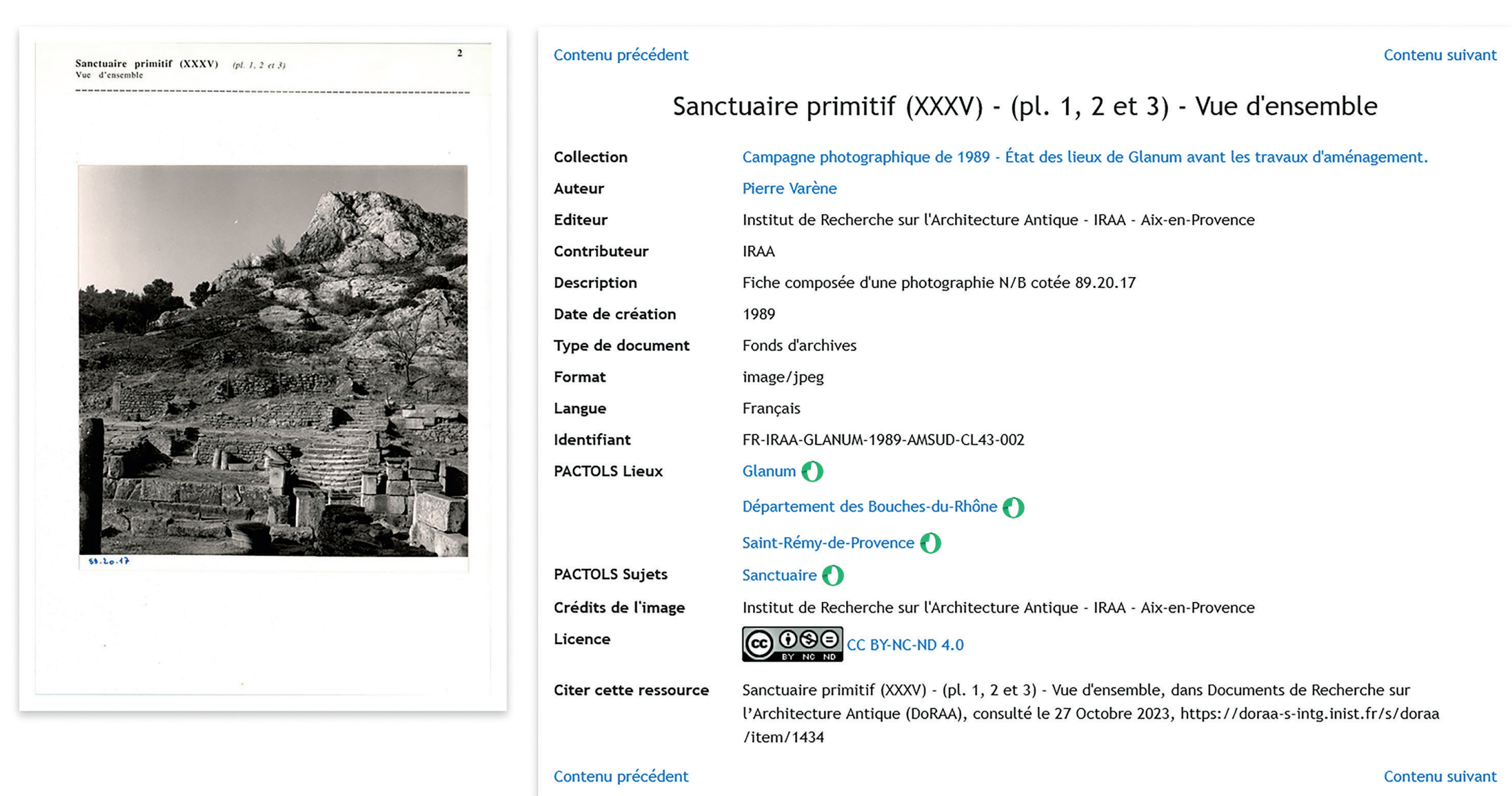
Fig. 3 : Exemple d'une fiche photographique de 1989 avec la légende d'origine et accompagnée de ses métadonnées - Campagne photographique dirigée par Pierre Varène avant les travaux d'aménagement du site archéologique pour l'ouverture au public. Copie d'écran de DoRAA.

Première mission de l'archiviste : recontextualiser les documents pour éclaircir les conditions et les moyens techniques de l'époque de leur production. Dans le cadre de la Science Ouverte, documenter les données anciennes impose l'utilisation de techniques numériques. Les principes FAIR donnent un cadre de traitement des documents. Le schéma de métadonnées Dublin Core, le thésaurus PACTOLS (vocabulaire contrôlé) et la licence CC offrent la possibilité de créer des contenus accessibles à un large public. L'archive numérique DoRAA joue ainsi un rôle important dans la diffusion de la connaissance du métier d'architecte-archéologue spécialiste des monuments antiques et montre la place de l'analyse architecturale dans les études d'archéologie.