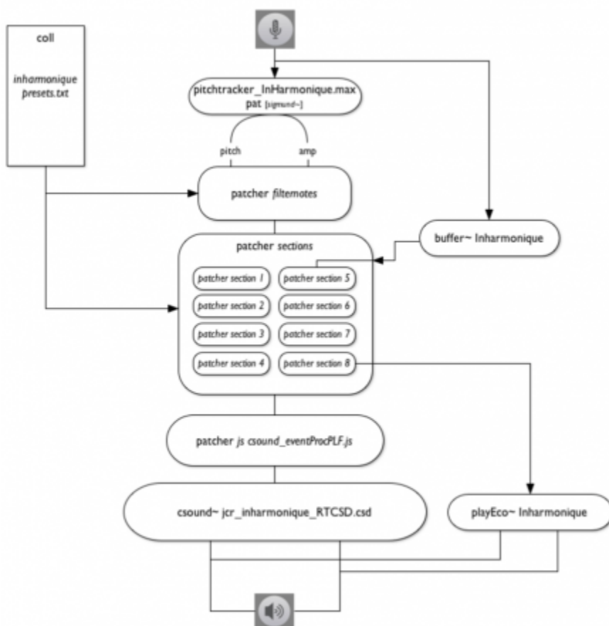
Figure 2. Schéma du patch jcr_inharmonique_RT.maxpat

38 Outre la précision nécessaire (valable pour les deux cas - temps différé et temps réel) dans ce travail, il y a l'adaptation dans l'accord de la voix de la chanteuse. Même si la partie vocale a été composée entièrement en tempérament égal, dans certaines parties le compositeur indique que la soliste doit s'adapter à l'inharmonicité des accords générés par l'électronique. Ainsi, la version temps réel souligne ces caractéristiques qui sont inexistantes dans la version originale.