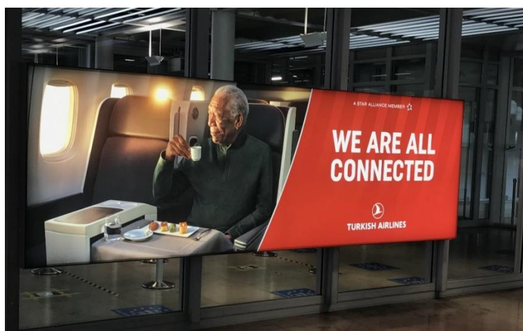
Figure 9.1. « Nous sommes tous connectés » : à qui s'adresse le « nous » de cette publicité d'une compagnie aérienne à l'aéroport de Nuremberg ?