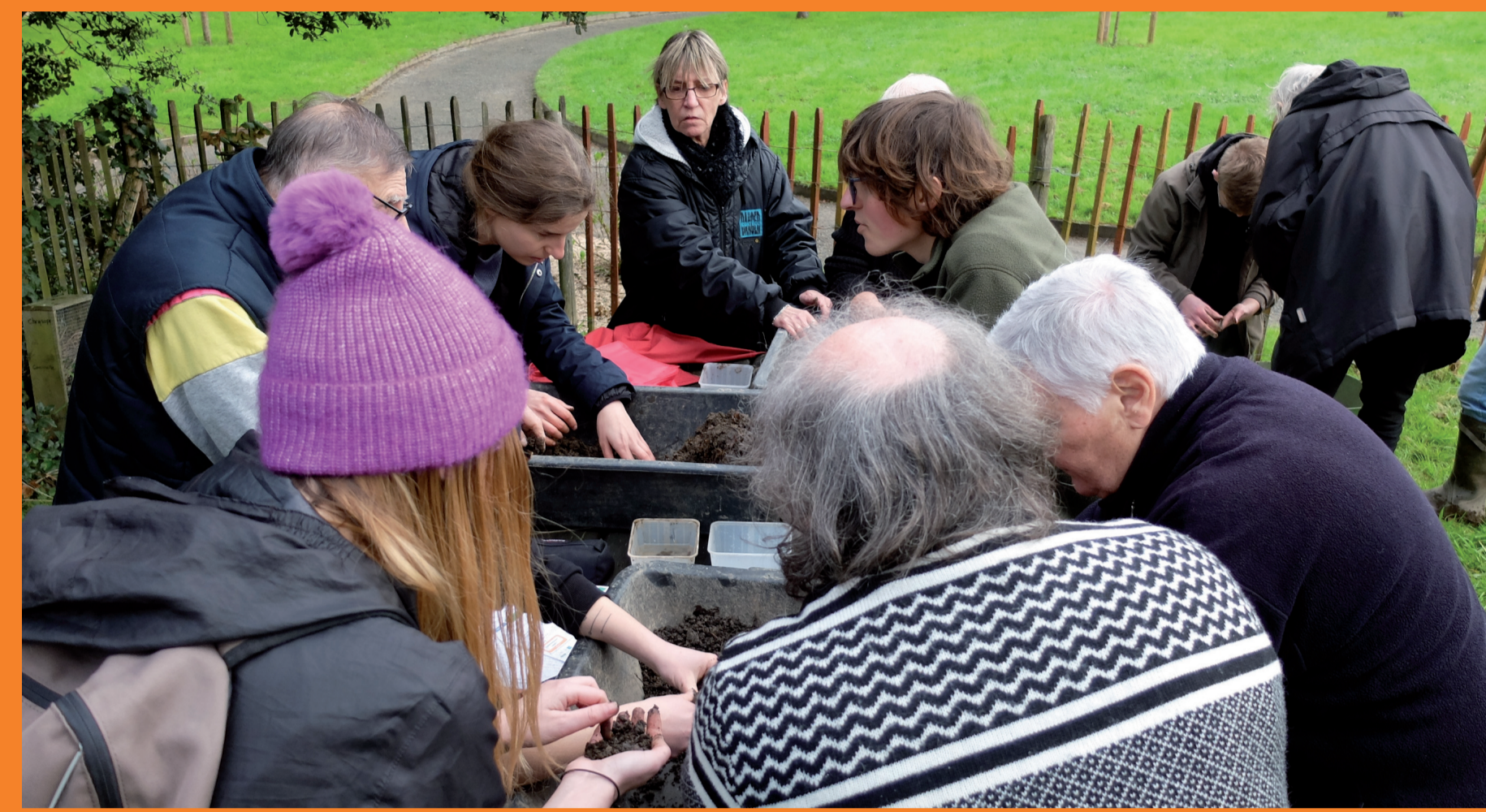
Tri des vers de terre avec les animateurs de l'Observatoire participatif des vers de terre, les jardiniers de la parcelle des dahlias du collectif Dignité cimetière, et avec les étudiantes du M2 ERPUR, au Jardin du bonheur à Maurepas