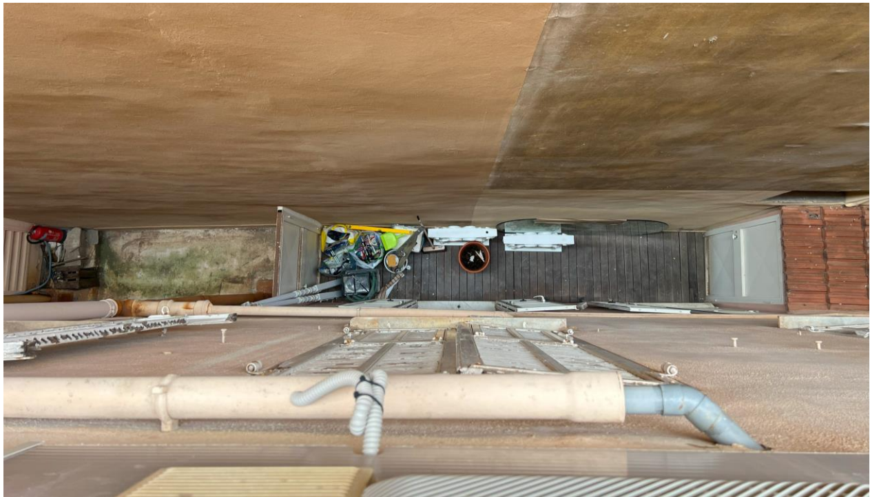
Fig.5 - Un espace interstitiel utilisé pour le stockage et l'embellissement

Les espaces libres situés entre les bâtiments sont souvent des endroits non identifiés, ni privés ni publics, mais collectifs. L'étude montre qu'ils sont souvent utilisés comme espaces utilitaires, même s'ils ne sont pas désignés comme tels. D'après nos observations, le mur devant la fenêtre représente un endroit tacitement laissé pour un usage personnel dans la majorité des cas. Lors de notre visite d'un appartement dans le quartier de la Condamine, dont les fenêtres donnent sur un mur, le propriétaire nous a montré comment les voisins du premier étage avaient utilisé l'espace interstitiel en dessous pour créer une zone privée de stockage (fig.5) avec plusieurs paquets contenant divers objets facilement identifiables : du scotch, de la colle, une éponge, quelques rouleaux de tissu, une serpillière, une petite pelle avec un balai, plusieurs tringles et quelques outils. On peut supposer que cette zone sert de rangement pour des articles utilisés pour le bricolage ou de petites réparations. Nous voyons également un grand morceau de verre ovale, probablement pour une table, un pot de fleur avec de la terre, ainsi qu'une cave aménagée de manière indépendante et recouverte de schiste, avec une porte peinte en blanc. Ainsi, les résidents du premier étage ont réussi à gagner quelques mètres carrés d'espace précieux, tient-on à préciser, à Monaco. En observant d'autres endroits similaires, nous avons rencontré des espaces de stockage pour des baskets, des pots, des casseroles.