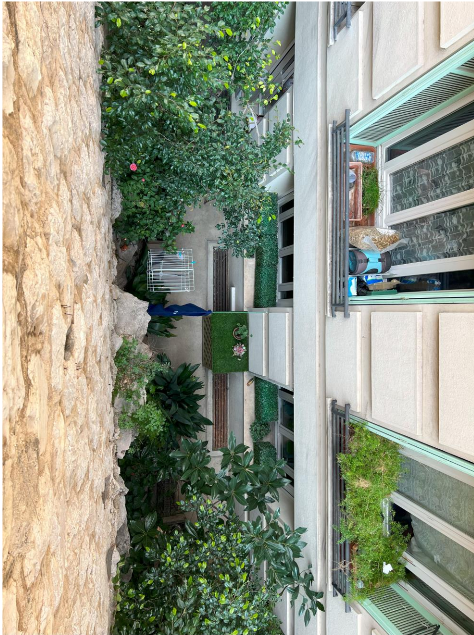
Fig.3 - Un espace interstitiel aménagé entre un mur en pierre et une fenêtre. Ce coin, bien végétalisé, respire la tranquillité et la créativité dans l'utilisation de l'espace urbain restreint. Les plantes apportent une touche de nature et de fraîcheur à un cadre autrement inanimé, transformant un espace confiné en un petit havre de paix et de beauté naturelle.

considérées comme « chanceuses ». Ailleurs, une fenêtre est éclairée par la lumière du soleil bien qu'elle soit située en face d'un mur (fig.4).