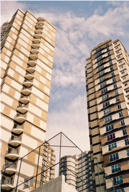
Tours d'habitation à Esenyurt

Radha est un jeune homme pakistanais qui vit à Istanbul depuis dix ans. Il vient d'une région à la frontière de l'Afghanistan et se présente comme pachtoun. Il est arrivé à Istanbul par bus, depuis l'Est du pays et ne connaît initialement personne dans la ville. Après quelques jours, un ami du « köy » (village) lui envoie le contact d'un homme pakistanais installé en Turquie depuis six mois et qui est çekçek (collecteur de déchets). Il emménage dans le logement de l'homme, un appartement en sous-sol dans le quartier de Bahçelievler, à une dizaine de kilomètres du centre historique, appartement qui abrite une quarantaine d'hommes migrants, la plupart en situation irrégulière, Afghans, Pakistanais et Syriens. Il y reste deux mois avant de trouver une place pour lui et son compatriote dans une chambre aménagée dans une ancienne