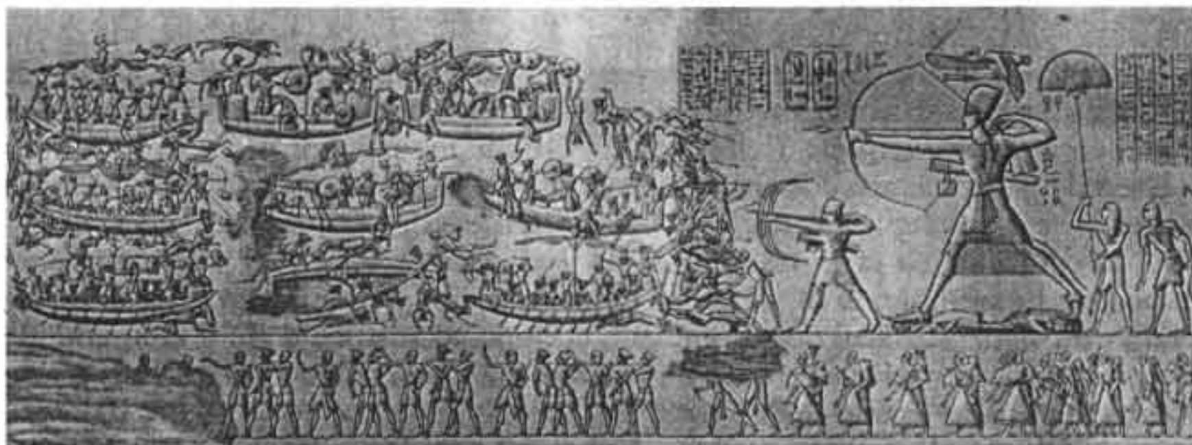
Fig. 4 ■ Cécile, Chabrol et Jomard. « Thèbes. Medynet-Abou. Combat naval sculpté sur la face extérieure du palais exposée au nord », Description de l'Égypte, Antiquités II , pl. 10. Les Indiens combattant les Égyptiens (Guerre contre les peuples de la Mer et les Philistins sous Ramsès III).

Jollois et Devilliers défendent la thèse d'une relation entre l'Afrique et l'Inde : « Nous sommes donc conduits à conclure que les Égyptiens, dès l'antiquité la plus reculée, ont trafiqué avec l'Inde ; que Thèbes est le premier comme le plus beau résultat connu de la puissance et des richesses que procurent le commerce aux peuples qui s'y adonnent. » 49 Mais ces relations n'ont pas toujours été sereines. Les ennemis des multiples scènes de batailles du temple de Médinet Habou 50 sont probablement des Indiens : ne portent-ils pas des sortes de « bonnets à plumes » 51 . Le fleuve figuré dans les scènes de combats navals est sans nul doute le Gange 52 .