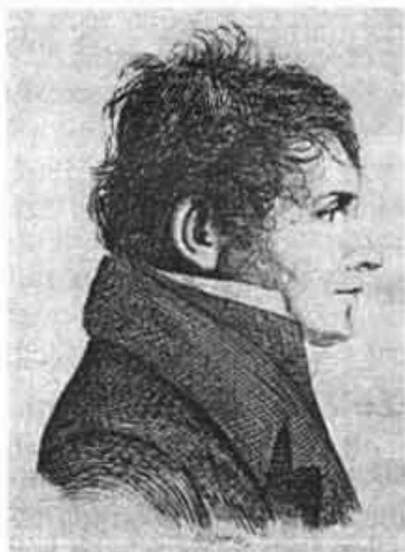
Raige, par André Dutertre

extrait de " L'expédition d'Égypte, une entreprise des Lumières 1798-1801 " Actes du colloque international organisé par l'Académie des inscriptions et belles-lettres et l'Académie des sciences, sous les auspices de l'Institut de France et du Muséum national d'Histoire naturelle, Paris 8-10 Juib 1998, textes réunis par Patrice Bret. Paris 1999.