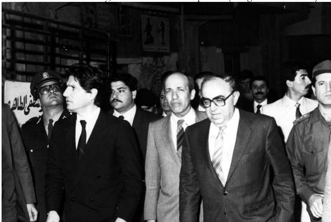
Photo 4 : Affiche de la campagne électorale des législatives de septembre 2000 : Rafiq Hariri posant au centre-ville devant la rue Maarad réhabilitée (architecture orientalisante datant du

Le 5 avril 1983, Amine Gemayel visite la banlieue-sud accompagné de militaires et de certains ministres, dont Bahaeddine Bsar, ministre du Logement et Adnan Mroueh, ministre des Affaires sociales et Pierre el-Khoury, ministre des Travaux publics (chargé de l'urbanisme).