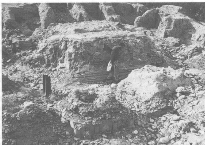
Hadda, Tape Shotor. La cour aux stoupas ruinée telle qu'elle se présentait en 1994.