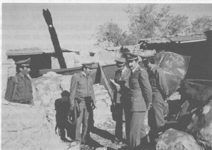
Hadda, Tape Shotor. La même cour quelques jours après l'incendie de 1992. Des officiers de l'armée communiste inspectent le site. Photo anonyme.