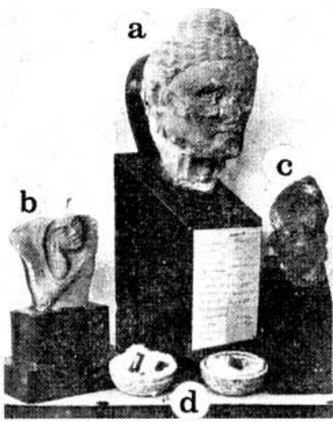
Fig. 6 (à gauche), Antiquités de Nejrāb, fouilles afghanes (d'après le Sālnāma, 1312).