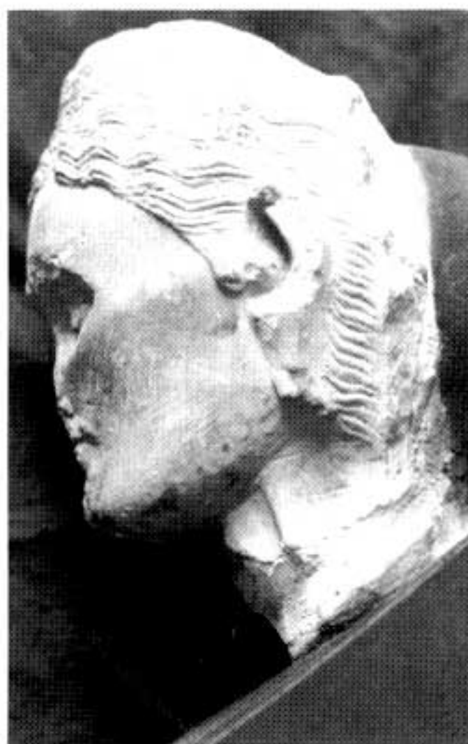
Fig. 2. Nejrāb, tête du Buddha pénitent vue de profil.