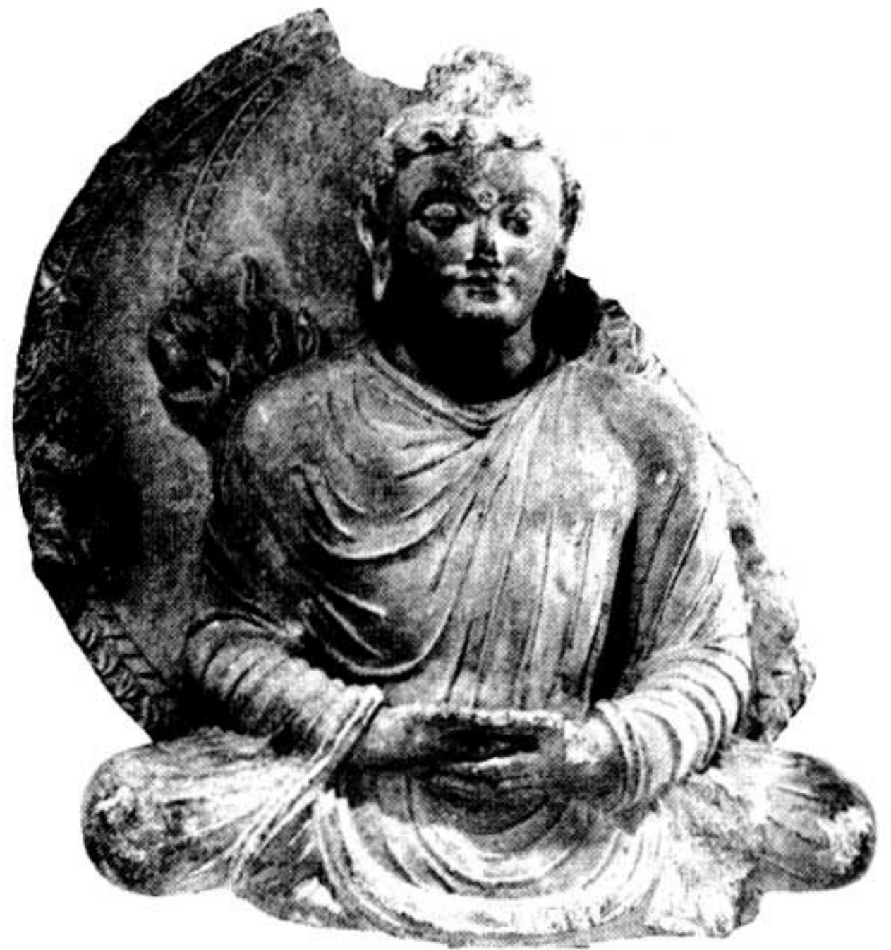
Fig. 10. Kābol–Kāpisā, Buddha nimbé et mandorlé en schiste (collection privée européenne, cliché Z. Tarzi).

Le Buddha est assis en padmāsana sur une fleur de lotus, les jambes repliées, les mains jointes – celle de droite en haut, les extrémités des pouces se touchant – en signe de méditation ( dhyaṇamudrā ), des flammes émergeant de ses épaules. Il est nimbé et mandorlé. Le nimbe et la mandorle forment l'arrière-plan sur lequel se détache l'image de Buddha en haut-relief. Le visage aux traits sobres est surmonté d'une coiffure composée de la chevelure proprement dite et de son uṣṇīṣa . La tête est endommagée à plusieurs endroits: le nez, l'œil et le