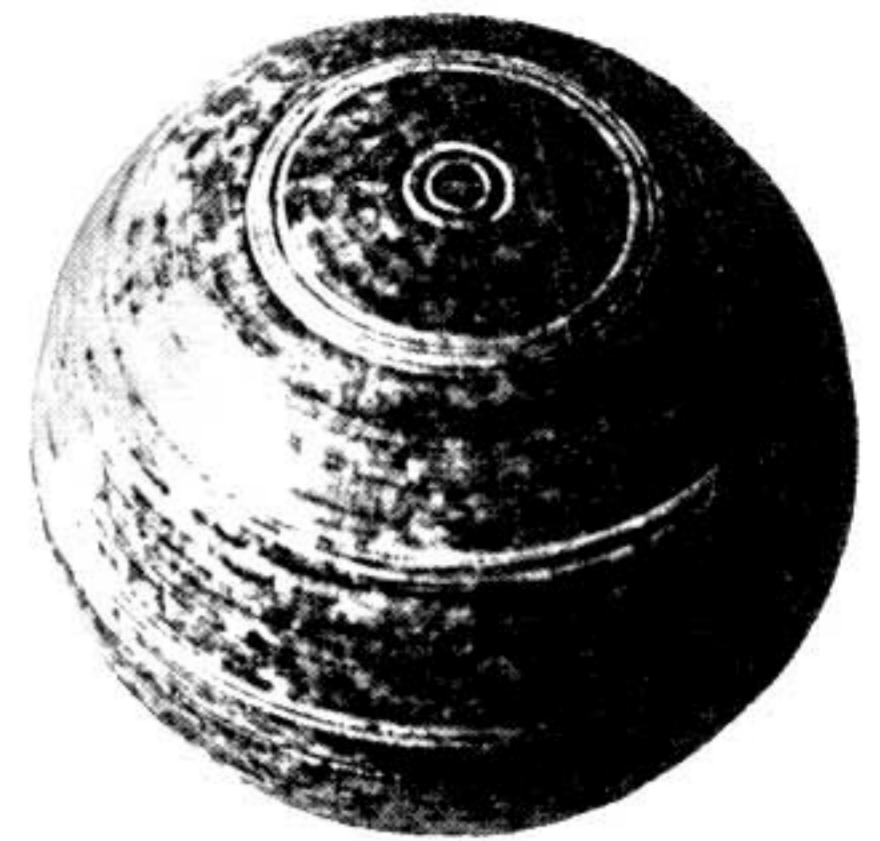
Fig. 4. Nejrāb I, reliquaire en stéatite du stūpa A.

Nous savons qu'en attendant l'arrivée du contrôleur, J. Carl procéda au déblaiement du chantier laissé par le Conservateur du Musée à l'intérieur de la cour du qal'a tout près du petit village. Il est question du dégagement des faces d'un petit stūpa. Les prises de vue de cette cour dans les archives de la DAFA au Musée Guimet, montrent un stūpa circulaire (C) qui semble être bâti à l'intérieur d'une rotonde – une chapelle – de plan carré de l'extérieur et circulaire de l'intérieur comme le no. 59 de Tape Shotor de Hadda 9 et Mirān III. 10 Ce qui est pris par J. Carl pour un petit stūpa n'est en réalité que le soubassement du jambage du côté droit de la porte en venant de l'extérieur. Sur le premier document photographique (fig. 3) nous voyons: au premier plan, en bas à droite, les limites extérieures de la chapelle de plan carré; au milieu à gauche, le stūpa circulaire; au milieu, les limites de la paroi intérieure de la rotonde aboutissant au jambage gauche de la porte lui faisant corps; enfin de l'autre côté, le jambage droit de l'entrée apparaît comme un petit stūpa nettement dégagé sur les trois côtés. Sur le deuxième document photographique, pris de