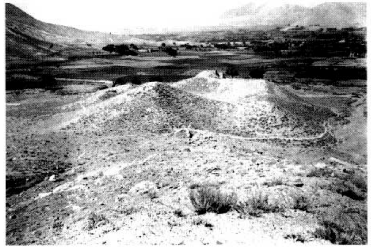
Fig. 7 (à droite). Site de Nejrāb II avant les fouilles.

se trouve en bas à gauche est le même reliquaire désigné par la lettre d (fig. 6). Il est représenté ouvert, et est composé de deux parties hémisphériques presque identiques; l'une, sans doute celle à main gauche, faisant office de couvercle, l'autre de reliquaire proprement dit. Il contenait des reliques composées de perles de pierres fines(?) de formes variées.