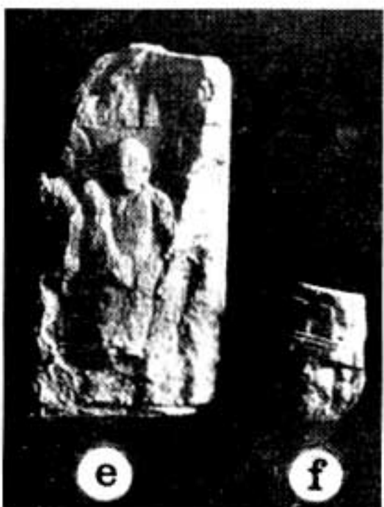
Fig. 8. Nejrāb, deux fragments de bas-relief en schiste, fouilles afghanes (d'après le Sālnāma , 1312).

c. La mauvaise qualité de la photographie ne laisse pas distinguer les détails de cette tête vraisemblablement en stuc.