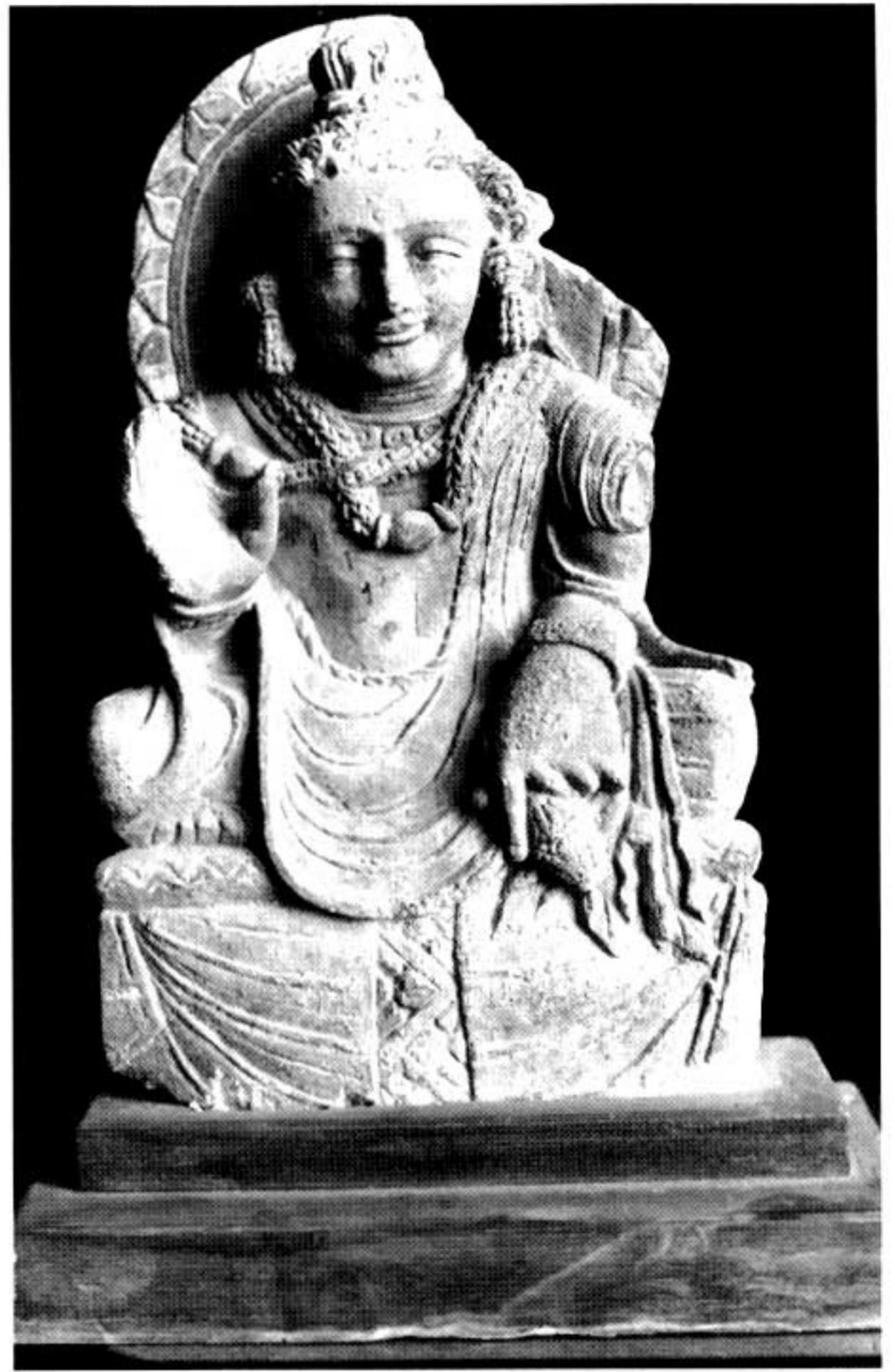
Fig. 9. Tchaghasarāy (Konar), Bodhisattva Maitreya en schiste.

Comme il se doit, nous essayons de faire une étude comparative, sans que cette comparaison apporte une solution miracle, mais elle tentera d'établir l'aire dont notre Bodhisattva dépendait. Tout d'abord, nous trouvons une similitude entre lui et des statues découvertes lors des fouilles de Chatpat dans le Swāt. Cette comparaison est limitée autant à cause des proportions "maladroites" des membres et de la tête des sculptures de la IIIe période de Chatpat qu'à cause de la ressemblance des nimbes aux contours ouvragés de feuilles. 22 En ce qui concerne le traitement particulier des