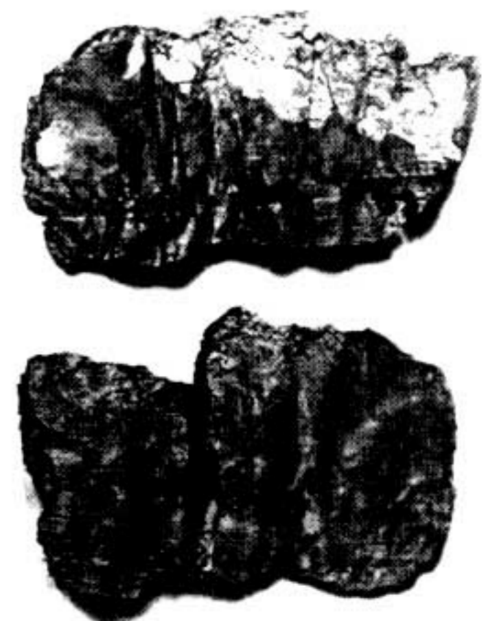
Fig. 5. Nejrāb I, deux rouleaux de parchemin accompagnant les reliques du stūpa A.

Effectué sous forme de tranchée il avait pour objet de trouver le reliquaire du stūpa A. Nous apprenons grâce au rapport de J. Carl que le conservateur afghan avait, en effet, réussi à sortir un reliquaire en pierre dure. Le document de la DAFA au Musée Guimet montre un reliquaire en stéatite dure ou schiste, tourné, de forme sphérique (fig. 4) accompagné de deux "rouleaux" de parchemin (fig. 5). Il se peut que le reliquaire en question et les parchemins ainsi que d'autres reliques qui se trouvaient à l'intérieur d'un reliquaire plus grand, sans doute en céramique, n'aient pas retenu l'attention de l'archéologue ni du photographe. Toutefois, sur le document photographique du Sālnāma , celui qui