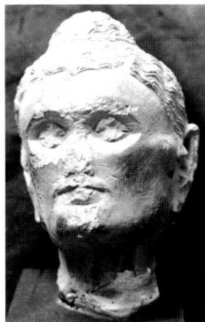
Fig. 1. Nejrāb, tête du Buddha pénitent vue de face.