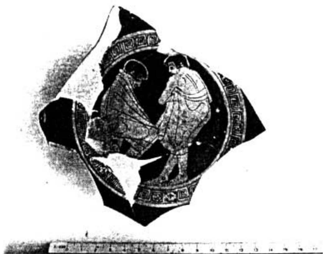
9. Fragment de coupe attique à figures rouges (fond interne).