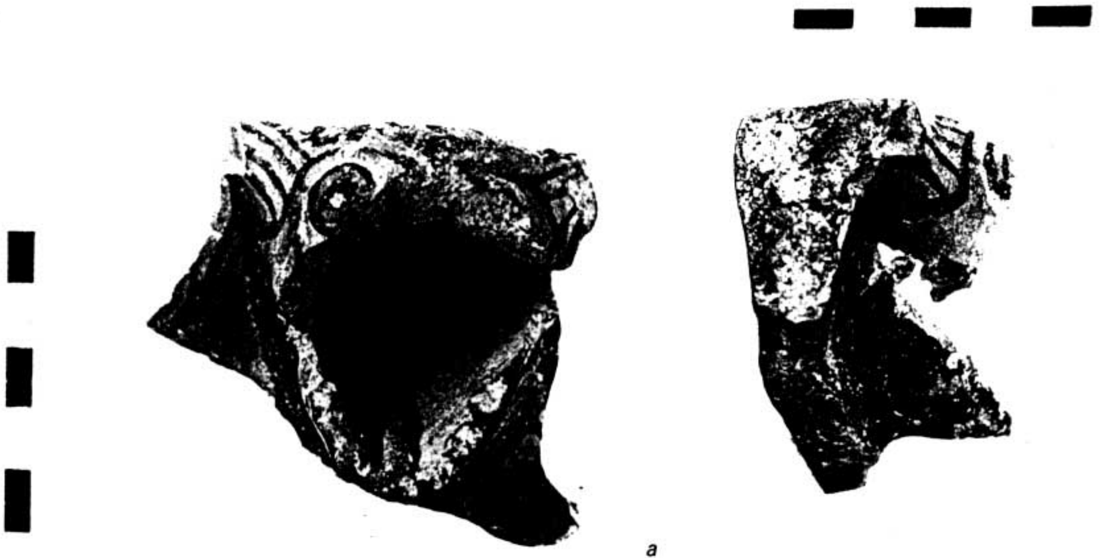
2a-b. Fragment de cratère orientalisant à protomè(s) animale(s).

Le VII e siècle et surtout le VI e siècle voient à Chypre une recrudescence des importations grecques 12 . Le phénomène ne peut être apprécié à partir des vases du palais tant que des sondages plus systématiques n'auront pu être effectués dans les états anciens de l'édifice. Quoiqu'il en soit, on dénombre tout de même une dizaine de fragments de skyphoi ioniens qui couvrent la fin du VII e et la première moitié du VI e siècle.