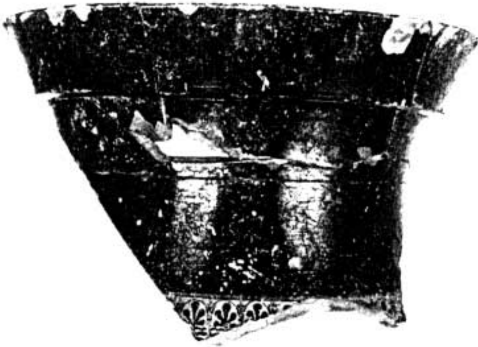
5. Fragment d'une amphore attique à figures noires (col).