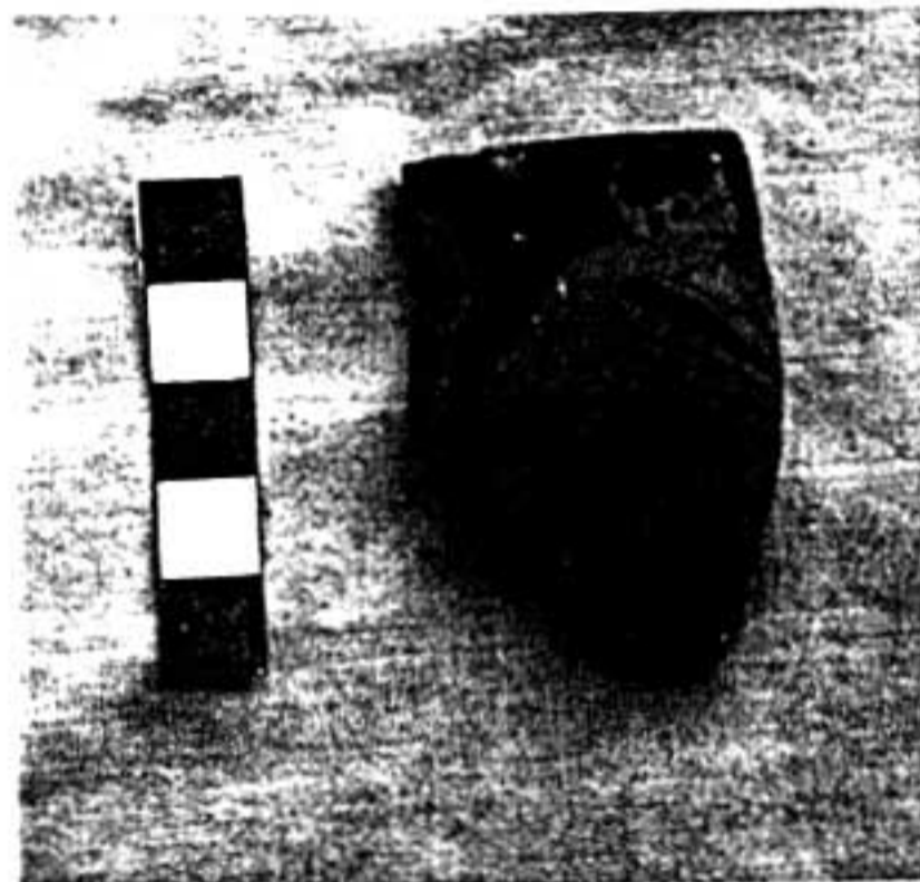
14. Fragment de skyphos attique à figures rouges (bord).

La seule description typologique ne saurait satisfaire l'historien ou l'archéologue soucieux de répondre à l'exigence formulée naguère par M. Wheeler, et opportunément rappelée ici même par A. Muller : derrière les artefacts, c'est bien l'homme qu'il faut atteindre 41 , les producteur, destinataire et utilisateur de l'objet, ainsi que l'usage qu'ils en font. Notons d'emblée que certains vases sont sans aucun doute des objets coûteux, voire luxueux. Bien sûr, les débats sur la valeur marchande de ces céramiques, décorées ou non 42 , et sur le concept de « céramique de luxe » ne sont pas clos 43 . Mais il est clair que ces vases grecs, notamment attiques, doivent être tenus à Chypre pour des objets de prestige. En la circonstance, la vaisselle d'importation paraît bien être dans l'île un « marqueur social ». La