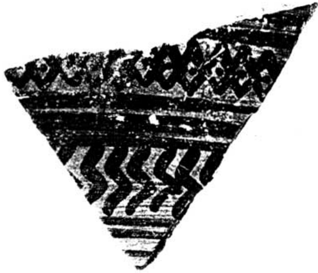
1. Fragment de cratère géométrique (attique ?).

Parmi ceux-ci, on note de nombreuses amphores égéennes et levantines 5 , et surtout un lot très important de céramiques grecques, en particulier attiques.