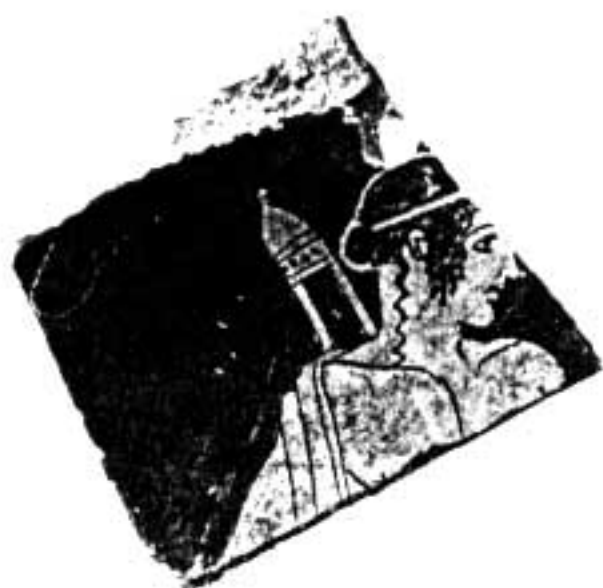
8. Fragment de coupe attique à figures rouges (fond interne) : Apollon (?).