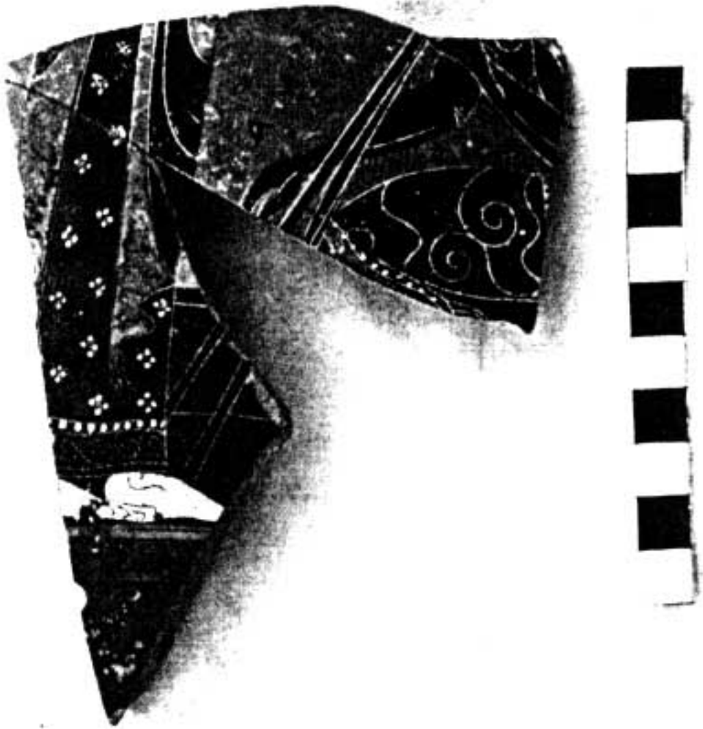
3. Fragment d'amphore attique à figures noires : Achille et Ajax jouant en présence d'Athéna.