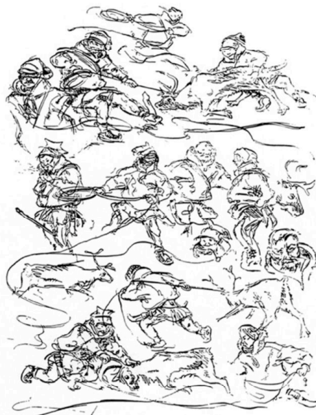
Fig. 2. Dans le corral.

Dessin de Ossian Elgström, Karesuandolapparna. Etnografiska skisser från Kõngämä och Lainiovuoma , 1922.