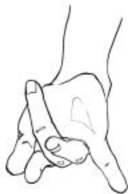
Figure 9: insulte sexuelle