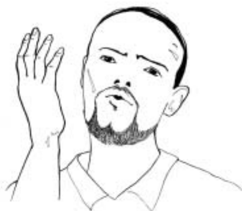
Figure 13: répondre à la menace