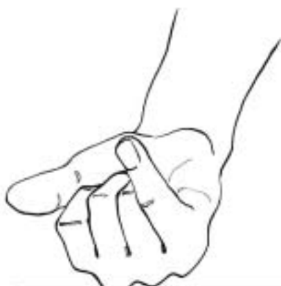
Figure 23: compter «1» méthode 4