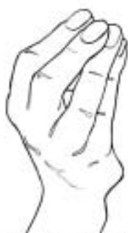
Figure 15: notifier d'attendre/ un peu