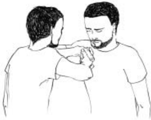
Figure 1: poignée avec baisers