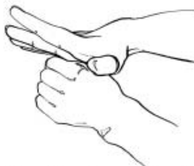
Figure 10: insulte sexuelle (var. 4)