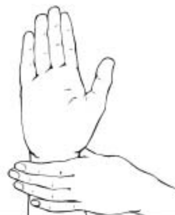
Figure 18: un document