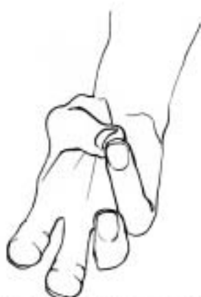
Figure 21: compter «1» méthode 2