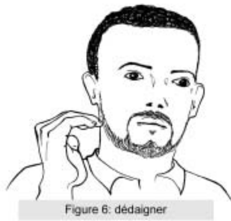
Figure 6: dédaigner