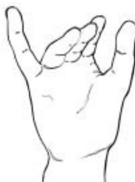
Figure 24: une moitié