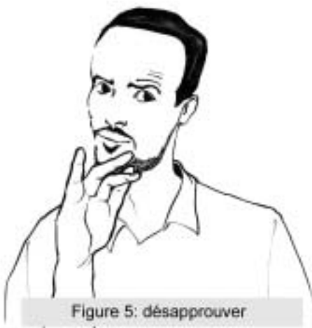
Figure 5: désapprouver