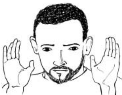
Figure 17: prier ou inviter à la prière