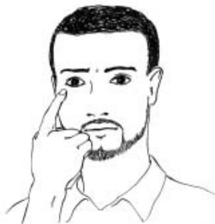
Figure 8: prévenir de sa revanche