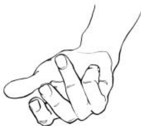
Figure 20: compter «1» méthode 1