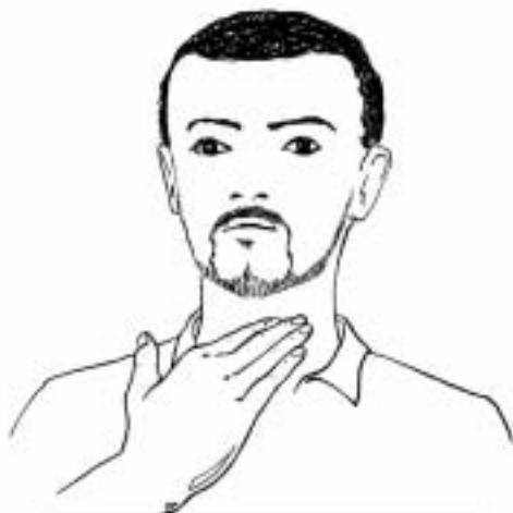
Figure 7: chercher à intimider