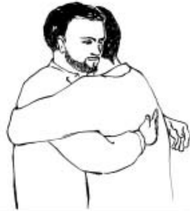
Figure 2: accolade entre hommes