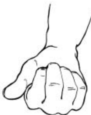
Figure 22: compter «1» méthode 3