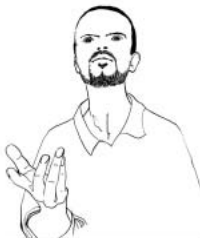
Figure 14: demander «quoi?»