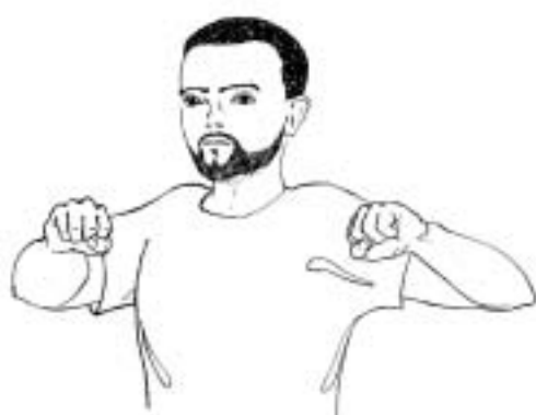
Figure 19: fort ou gros