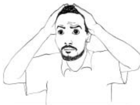
Figure 12: catastrophe