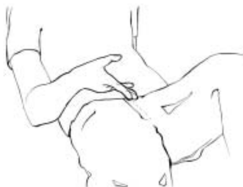
Figure 11: insulte sexuelle (var. 5)