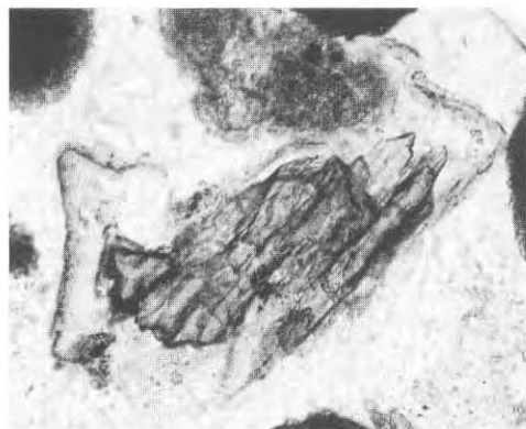
Dans la séquence de Casablanca, les «augites aciculaires», minéraux volcaniques originaires du Moyen Atlas, marquent la base du Quaternaire, vers 1,8 millions d'années.

Depuis 1978, le programme de coopération franco-marocain mené à Casablanca a permis la révision de cette séquence classique, étagée de 180 m d'altitude jusqu'au zéro actuel, et la datation de points clés. Elle débute à la fin du Miocène (Messinien), vers 6 millions d'années, dans un contexte de climat régional à tendance aride, synchrone d'un abaissement généralisé des océans d'environ 50 m en liaison avec l'extension de la calotte antarctique entre 7 et 5 millions d'années. Les formations rencontrées entre 120 et 100 m datent du Pliocène moyen, antérieurement à 2,4 millions d'années : elles témoignent de variations bathymétriques impliquant des aller-retours multiples de la mer sur une plate-forme relativement stable, sans que cela implique pour autant des changements significatifs du climat régional. À partir du Pléistocène inférieur en revanche, la diversité et la complexité des enregistrements étagés, emboîtés, voire superposés, entre 90 m et le zéro actuel, s'explique par un contrôle tectonique combiné avec des variations de plus grande ampleur du niveau océanique. La longue séquence de Casablanca représente donc, dès le Miocène final, un enregistrement exceptionnel des variations du niveau de l'Océan mondial, en relation avec les fluctuations de l'englacement planétaire aux hautes latitudes dont un état provisoire est consigné dans le tableau ci-après.