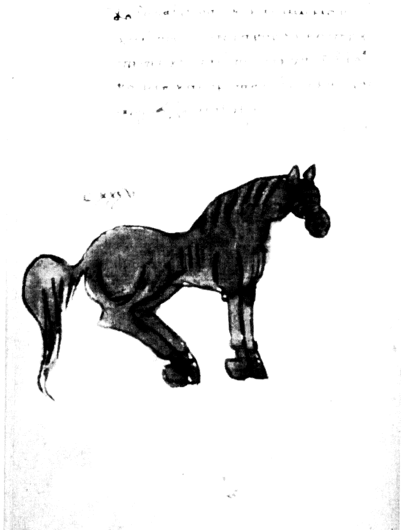
Fig. 5. – Leyde, Bibliotheek der Rijksuniversiteit, Vos. gr. Q. 50, f. 123 v , milieu XIV e s.: [Anonyme], Epitomè.