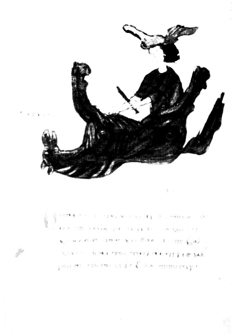
Fig. 6. – Leyde, Bibliotheek der Rijksuniversiteit, Vos. gr. Q. 50, f. 135 v , milieu XIV e s.: [Anonyme], Epitome .