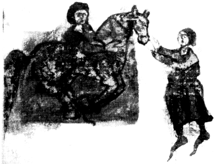
Fig. 1. – Leyde, Bibliotheek der Rijksuniversiteit, Vos. gr. Q. 50, f. 102 v , milieu XIV e s.: [Anonyme], Épitomè .