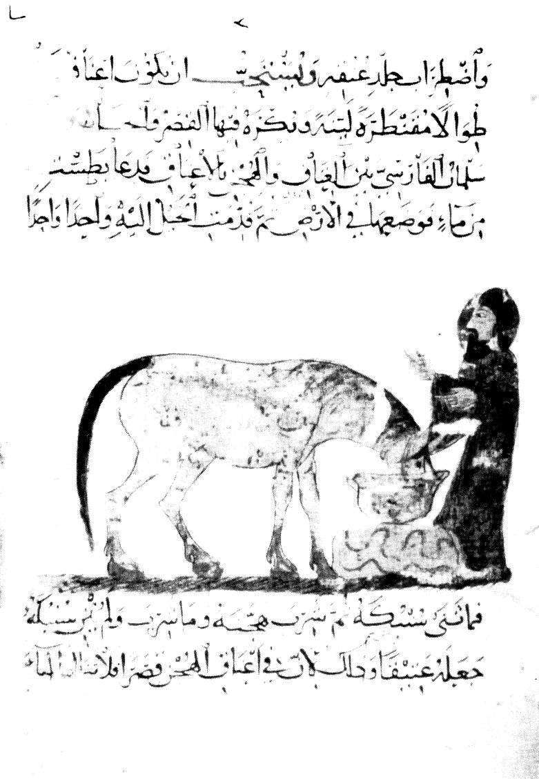
Fig. 8. - Istanbul, Topkapı Sarayı Müzesi Kütüphanesi, Ahmed III , 2115, de l'année 606 de l'hégire (= 1210), f. 14 v (13 v ): Ahmad ibn al-Hasan ibn al-Ahmad, Kitab al-baitara .