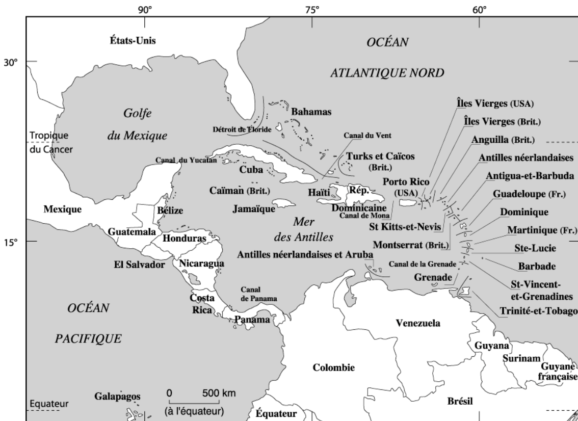
Carte 1. Le bassin Caraïbe Conception : F. Taglioni ; Réalisation : F. Bonnaud (Paris-Sorbonne)

États-Unis compris) regroupe plus de 270 millions d'individus sur 6,2 millions de km 2 terrestre.