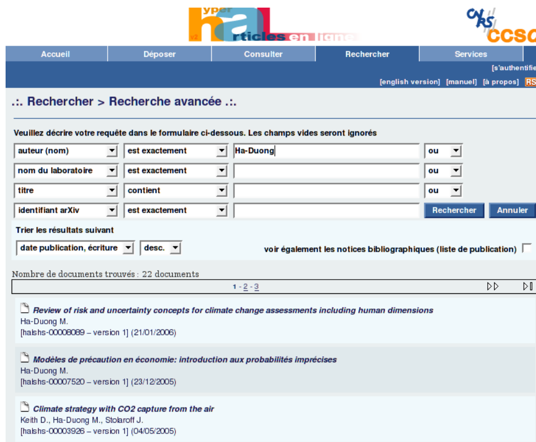
Illustration 2.: Les données sources dans HAL.