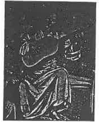
ill. 11 Luca Signorelli (c. 1441- ? 1523), Le Couronnement des élus , fresque de la cathédrale d'Orvieto, détail : l'ange central chantant et s'accompagnant à la vihuela.