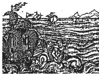
ill. 21 Luis de Narváez, Los seys libros del Delphin... , Valladolid, Diego Hernández de Córdoba, 1538, détail.