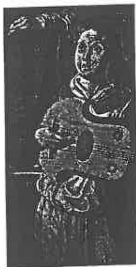
ill. 1 Pablo de Aregio (Valence, vers 1506), La Vierge et l'Enfant avec des anges et deux donatrices , Enguera près de Valence, église San Miguel, détail de l'instrument.

Mais les motifs décoratifs de table peuvent être en partie supérieure et inférieure de l'instrument (soit quatre motifs), comme en témoigne l'exemplaire représenté dans le tableau du Maître de Perea (ill. 2), ou celui de l'ange sur panneau de bois de la cathédrale de Barcelone (ill. 3), ou encore celui du Couronnement de la Vierge par un maître anonyme, publié pour la première fois par Antonio Corona-Alcalde ici même 1 . Ce motif peut aussi se trouver soit au sommet de l'axe principal de la caisse, comme dans l'ange du Couronnement du Maître de Saint-Lazare (ill. 4), soit combiner tous ces emplacements. Il en est ainsi de l'instrument tenu par un ange, dans le tableau de Rodrigo Osona, la Vierge à l'Enfant , conservé à l'église Notre-Dame d'Ibiza 2 (ill. 5), ou de celui représenté sur la stalle gravée du chœur de la cathédrale de Burgos découverte par Antonio Corona-Alcalde 3 (ill. 6). Mais ces motifs peuvent être disposés en plus à la partie médiane de la table, rythmant ainsi toute sa surface, comme sur la gravure sur bois du traité de