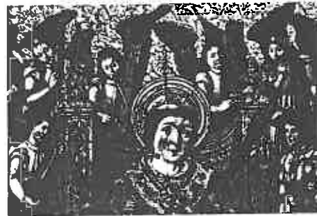
ill. 15 Anonyme (Espagne, xvi e siècle), Saint Vincent entouré d'anges , détail : les anges musiciens.

10 Woodfield, op. cit. , p. 81-82. Voir aussi Gianpaolo Gregori, « La liuteria nell'iconografia cremonese », in Strumenti, musica e ricerca. Atti del Convegno internazionale. Cremona 28-29 ottobre 1994 , A cura di Elena Ferrari Barassi, Marco Fracassi, Gianpaolo Gregori, Crémone, Ente Triennale internazionale degli strumenti ad arco, 2000. Voir son chapitre 3 : Delle vihuelas o viole da mano e da arco , p. 82-91.