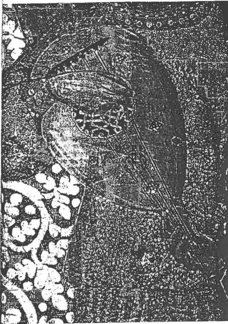
ill. 7 Anonyme (fin du xv e siècle), La Vierge allaitant , Musée diocésain de Valence, détail de l'instrument tenu par un ange.