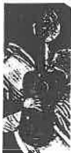
ill. 4 Maître de Saint-Lazare (début du xvi e siècle), Couronnement de la Vierge , Valence, collection Gonzales-Martí, détail de l'instrument tenu par un ange.