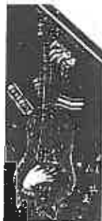
ill. 3 Anonyme (xvi e siècle), Ange musicien , panneau de bois, cathédrale de Barcelone, détail de l'instrument.