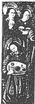
ill. 2 Maître de Perea (milieu du xv e siècle), Vierge à l'Enfant , anciennement à la collégiale de Jativá, détail de l'instrument tenu par un ange.