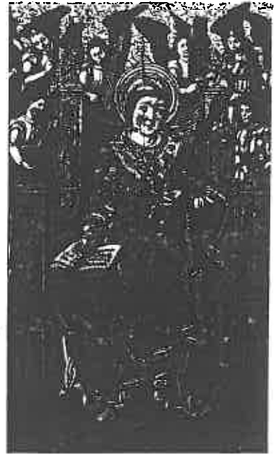
ill. 20 Anonyme (Espagne, xvi e siècle), Saint Vincent entouré d'anges , © Museu de Lleida Diocesà i Comarcal (Catalogne).