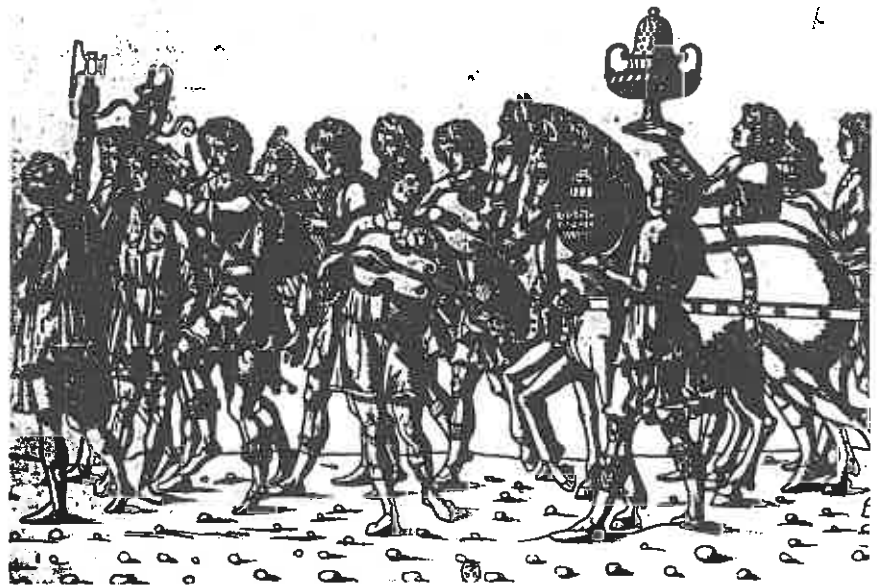
ill. 24 Jacopo da Strabourg, Les Triomphes de César , gravure sur bois, Venise, 1503, Paris, BNF, Estampes, détail des bouffons et joueurs de vihuela.

Gil de Silvé ou encore Alejo de Vahia (auteur de deux sculptures pour le retable de Plasencia et d'une Crucifixion datée vers 1500, aujourd'hui au Museo Marés à Barcelone). Elle insiste sur le fait que tous ces artistes avaient assimilé la Renaissance italienne et conclut finalement en suggérant le nom de Rodrigo Alemán, sculpteur sur bois d'origine allemande, actif en Espagne de 1489 à 1503, auteur des stalles des cathédrales de Tolède (1489-1495) et de Plasencia.