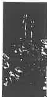
ill. 5 Rodrigo Osona, Vierge à l'Enfant , c. 1500, fresque (?), église Notre-Dame à Ibiza, détail d'un ange musicien jouant de la vihuela.