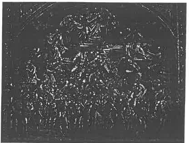
ill. 18 Luca Signorelli (c. 1441- ? 1523), Le Couronnement des élus au Paradis , fresque de la cathédrale d'Orvieto.