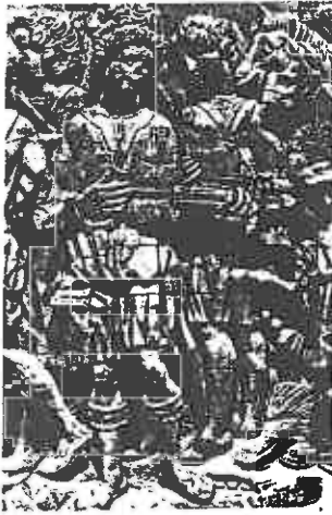
ill. 23 Ateliers de Tolède et Plasencia (?), Le Triomphe de César , frises en hauts-reliefs du château de Vélez Blanco (Andalousie), Paris, Musée des arts décoratifs, détail de la quatrième frise.