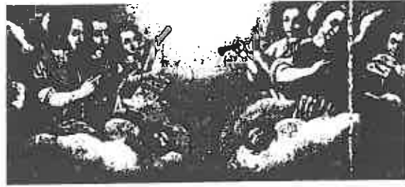
ill. 14 Pere Cuquet (?-1666), Le Martyre de saint Félix, Saint Félix de Codines (Catalogne) .