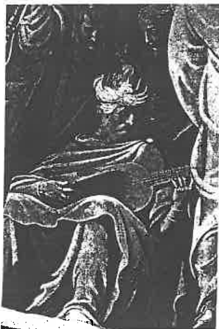
ill. 17 Bernardino Campi (1522-1590/95), Le Roi David, fresque de l'église Saint-Sigismond à Crémone, 1570, détail.

Comme indiqué en introduction, les deux tiers des représentations de vihuela que nous avons étudiées (mais nous ne prétendons nullement avoir réuni un corpus exhaustif) se rapportent à la religion chrétienne. Le Nouveau Testament, et tout particulièrement les sujets ayant trait à la vie de la Vierge Marie et de Jésus, fournissent des thèmes allant de la Nativité (deux exemples), en passant par des Madones à l'Enfant (huit exemples), la Présentation de Jésus au temple et enfin le Couronnement de la Vierge (trois exemples) dont l'inspiration n'est pas éloignée de celle du Couronnement des élus au Paradis tel que Luca Signorelli l'a peint dans la cathédrale d'Orvieto (ill. 18).