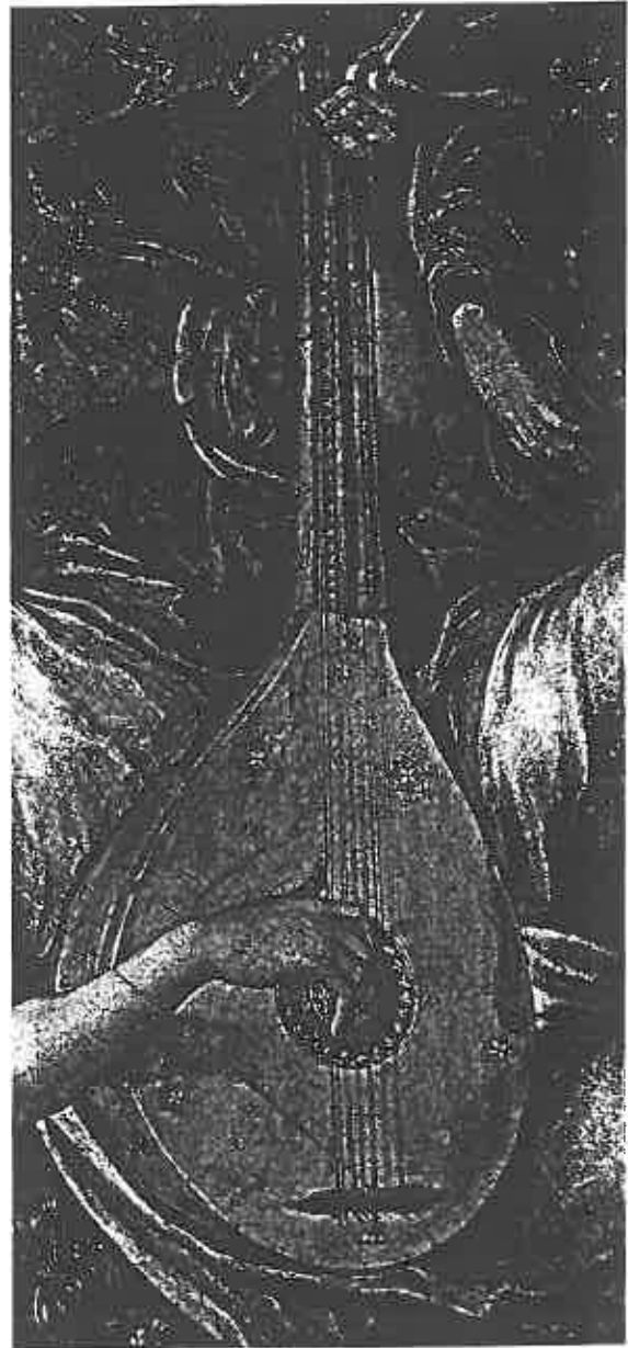
ill. 8 Gregorio Lopes (Lopez) (?-avant 1550), La Vierge à l'Enfant , Lisbonne, Museu nacional de Arte antiga, détail de l'instrument tenu par un ange.