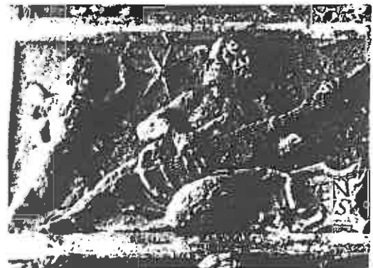
ill. 22 Auteur inconnu, Vénus et Cupidon , bas-relief, Espagne (?), xvi e siècle (?).

La vihuela participe aussi souvent, entre les mains d'un ange, à la vie des saints, notamment dans des scènes de martyre (ill. 19) tel Le Martyre de saint Félix , par Pere Cuquet (?-1666), à Saint Félix de Codines (Catalogne) ou des scènes de dévotion comme cette représentation anonyme de Saint Vincent entouré d'anges (ill. 20).