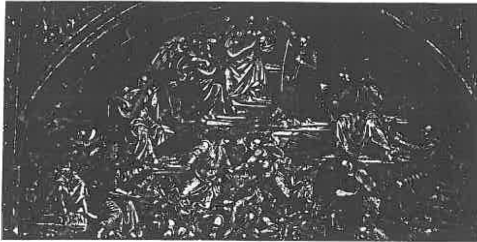
ill. 10 Luca Signorelli (c. 1441-? 1523), Le Couronnement des élus , fresque de la cathédrale d'Orvieto, détail des anges musiciens.