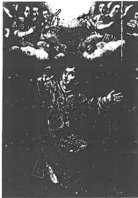
ill. 19 Pere Cuquet (?-1666), Le Martyre de saint Félix , Saint Félix de Codines (Catalogne).