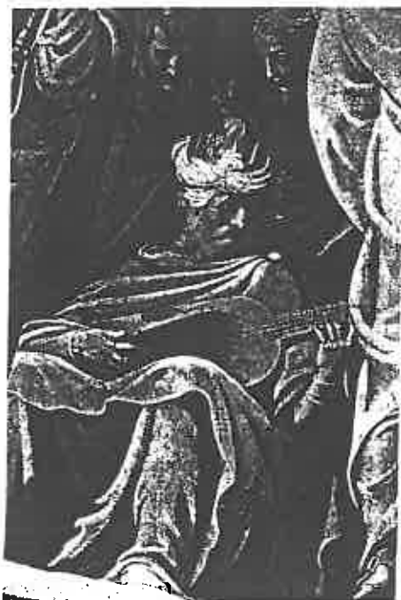
ill. 17 Bernardino Campi (1522-1590/95), Le Roi David, fresque de l'église Saint-Sigismond à Crémone, 1570, détail.

Comme indiqué en introduction, les deux tiers des représentations de vihuela que nous avons étudiées (mais nous ne prétendons nullement avoir réuni un corpus exhaustif) se rapportent à la religion chrétienne. Le Nouveau Testament, et tout particulièrement les sujets ayant trait à la vie de la Vierge Marie et de Jésus, fournissent des thèmes allant de la Nativité (deux exemples), en passant par des Madones à l'Enfant (huit exemples), la Présentation de Jésus au temple et enfin le Couronnement de la Vierge (trois exemples) dont l'inspiration n'est pas éloignée de celle du Couronnement des élus au Paradis tel que Luca Signorelli l'a peint dans la cathédrale d'Orvieto (ill. 18).