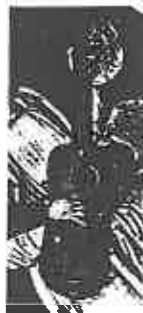
ill. 4 Maître de Saint-Lazare (début du xvi e siècle), Couronnement de la Vierge , Valence, collection Gonzáles-Martí, détail de l'instrument tenu par un ange.