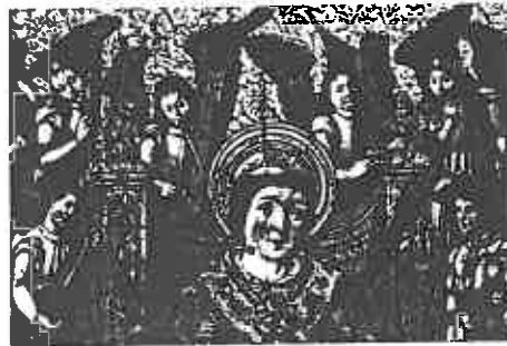
ill. 15 Anonyme (Espagne, xvi e siècle), Saint Vincent entouré d'anges , détail : les anges musiciens.

10 Woodfield, op. cit. , p. 81-82. Voir aussi Gianpaolo Gregori, « La liuteria nell'iconografia cremonese », in Strumenti, musica e ricerca. Atti del Convegno internazionale. Cremona 28-29 ottobre 1994 , A cura di Elena Ferrari Barassi, Marco Fracassi, Gianpaolo Gregori, Crémone, Ente Triennale internazionale degli strumenti ad arco, 2000. Voir son chapitre 3 : Delle vihuelas o viole da mano e da arco , p. 82-91.