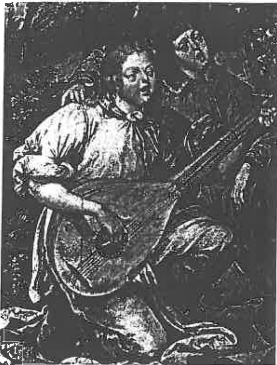
ill. 12 Gregorio Lopes (Lopez) (?-avant 1550), La Vierge à l'Enfant , Museu nacional de Arte antiga de Lisbonne, détail des anges chantant en s'accompagnant.