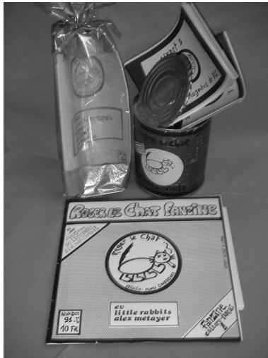
Photo 1. Variabilité du support physique du fanzine Roger le Chat, n° 1 à 3, 1991-1992.

L'importance de la photocopieuse comme outil de reproduction impose tout naturellement un format : A4 ou A5, le A5 étant privilégié par les fanzines punks (possibilité de le mettre dans une poche et de le transporter avec soi). C'est un format de base que le pliage ou le découpage permet de moduler : Inside Susan est découpé de manière circulaire dans une page A4, alors que Supersonic Jazz , Le Stéréophile ou Monotrans & Satellites adoptent le format oblong (A4 plié en deux dans le sens de la hauteur).