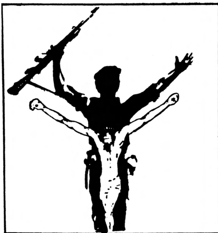
Affiche sandiniste au Nicaragua

(extrait de François Chevalier, L'Amérique latine de l'indépendance à nos jours , p. 476)